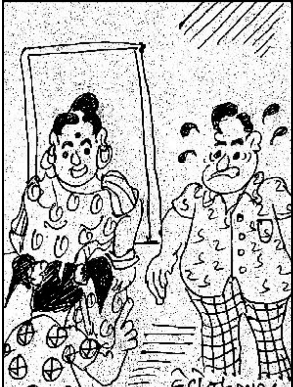
મા, તને અને પિતાજીને અંગ્રેજોનો સ્પેલીંગ નથી આવડતો અને મને અંગ્રેજીમાં ભણાવાનો આગ્રહ શા માટે રાખો છો ?