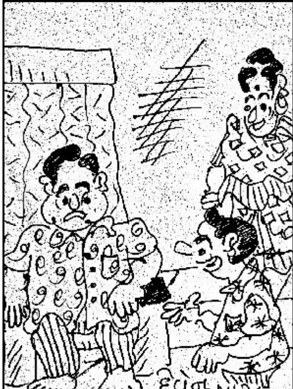
પિતાજી, તમે મને ક્રિકેટ રમવાની ના કહો છો અને તમે ક્રિકેટની રમત ઉપર જુગાર રમો છો !