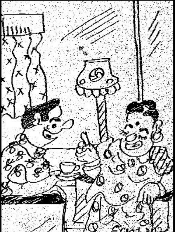
આ કાળાનાણાં ભેગા કરનારા નેતાનાં મોઢા કાળા થઈ જતા હોય તો ?