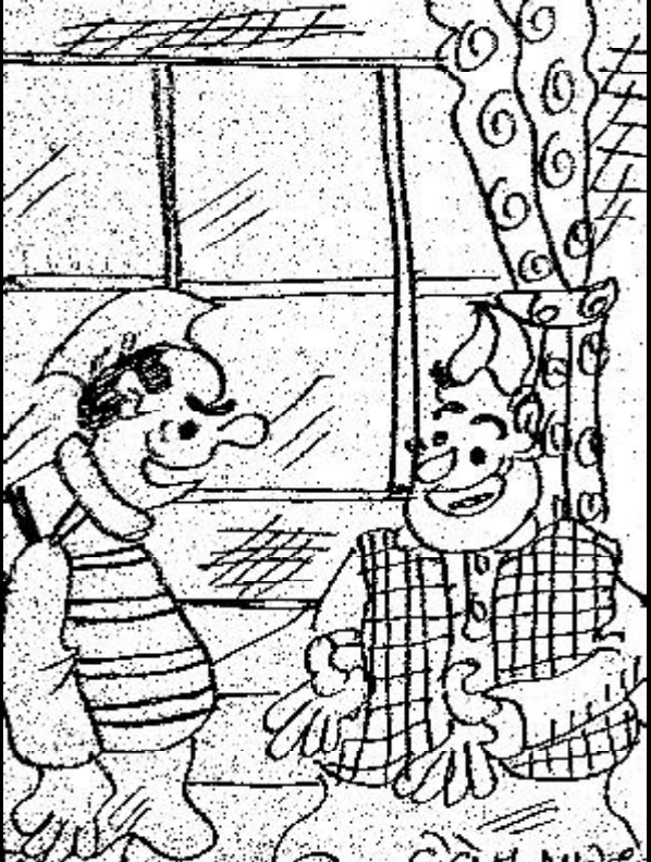
જેમ પાપ ધોવા ગંગાસ્નાન કરવું પડે તેમ સફળ નેતા સાબિત થવા કૌભાંડ કરવું પડે !

સર્વેમાં મિજાદે ૨૦૧૦માં બની શકે છે. સમગ્ર વિશ્વમાં સાયન્સ મેગેઝિનને જણાવ્યું હતું કે જો અફઘાનિસ્તાનમાં થોડાં વર્ષો શાંતિ રહે છે અને મિનરલ્સ માત્ર ઉદ્યોગોના ઉપકારક છે. આ દેશોમાં ચીન, રિપબ્લિક એ એક દાયકામાં આ ક્ષેત્રનો સૌથી અમીર દેશમાંથી એક સામેલ છે.