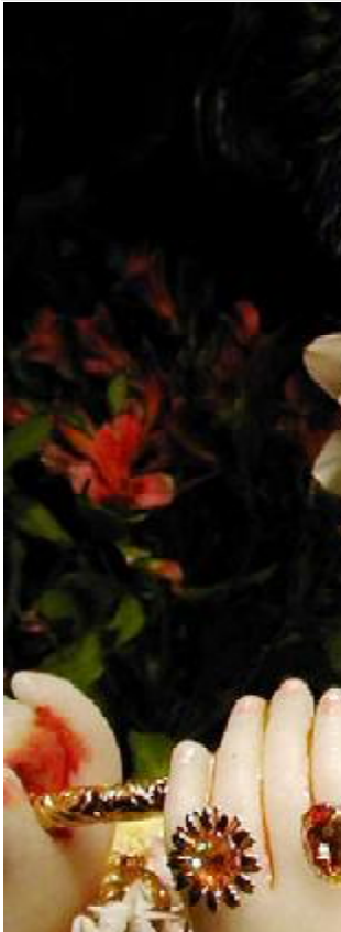
ત્રિભુવનનાં નાથ ભગવાન શ્રી હરીનું જન્મ અવતરણ એટલે કૃષ્ણ જન્મોત્સવ.

શ્રાવણ મહિનાની વદ સાતમ તીર્થોનું વ્રત શીતળા માતાજીના નામથી કરવામાં આવે છે. આ વ્રત ખાસ કરીને બહેનો કરે છે. શીતળા માતાનું વ્રત મહત્ત્વ એ છે કે કોઈપણ વ્રત રાખનાર એમની પૂજા કરે છે. શારીરીક, એમની પૂજા કરે છે. શારીરીક, અને પ્રારબધના તાપથી મુક્ત થઈ જાય છે. આ વ્રત પુત્ર પ્રાપ્તિ કરવા વાળું અને સૌભાગ્ય આપવા વાળું છે. પુત્રીની ઈચ્છા રાખવા વાળી મહિલાઓ માટે આ વ્રત ઉત્તમ કહેવામાં આવે છે.