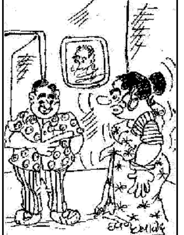
મને તો શંકા છે કે તારે કારણે જ મોંઘવારી વધી રહી છે !