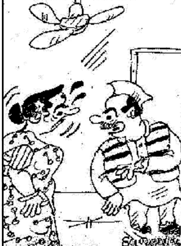
પ્રજાનાં પ્રશ્નો કે સંસદની ચર્ચા નથી સાંભળી શકતો, ત્યાં તારી વાત ક્યાંથી સાંભળી શકું ?

ઉણપ પૂર્ણ કરવામાં મદદ મળે છે. તેમજ મહિલા અને બાળકમાં લોહીની વધારે કમી હોય છે તેથી તેણે ચણાનું સેવન કરવું જોઈએ. આંખો માટે ફાયદાકારી : પલાળેલા ચણામાં બી કેરોટીન નામનો તત્વ હોય છે. આ આંખોની કોશિકાઓને સુરક્ષિત રાખવામાં મદદ કરે છે. તેથી આંખોની રોશની વધારવા અને તેનાથી સંકળાયેલી સમસ્યાથી બચવા માટે દરરોજ પલાળેલા ચણાનું સેવન કરવું. હાડકાઓ થશે મજબૂત : તેને ચાવવાથી એક પ્રકારની એક્સરસાઈઝ હોય છે. તેથી દરરોજ પલાળેલા ચણા ખાવાથી દાંત અને હાડકાઓને મજબૂતી મળે છે. પાચન તંત્ર કરે મજબૂત : ઉનાળામાં લોકોને પાચનથી સંકળાયેલી સમસ્યા વધારે હોય છે. તેમાં ફાઈબરથી ભરપૂર પલાળેલા ચણાનું સેવન કરવું બેસ્ટ ગણાય છે. તેના સેવનથી પાચનશક્તિ સારી થઈ અને પેટ સાફ રહે છે. તેની સાથે નબળાઈ દૂર થઈને શરીરમાં મજબૂતી આવે છે. તેથી પાચન સંબંધી સમસ્યાઓથી બચવા માટે દરરોજ સવારે ખાલી પેટ પલાળેલા ચણાનું સેવન કરવું.