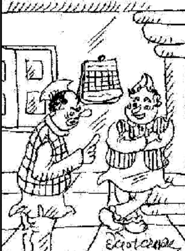
રાજકારણમાં રહીએ પછી આપણને ક્યારેય અંતરઆત્માનો અવાજ સંભળાય ખરો ?