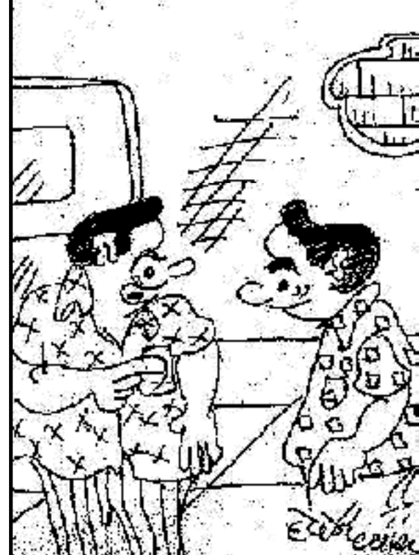
તારા માથાનાં દુઃખવાની ફરિયાદો સાંભળી સાંભળીને હવે મારું માથું દુઃખવા માંડ્યું છે !