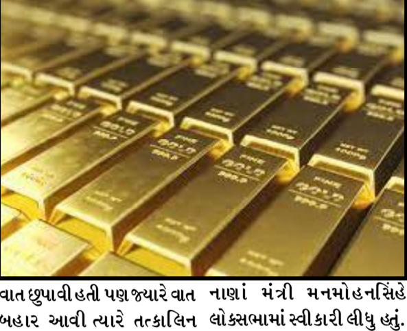
વાત છુપાવી હતી પણ જ્યારે વાત નાણાં મંત્રી મનમોહન સિંહે બહાર આવી ત્યારે તત્કાલિન લોકસભામાં સ્વીકારી લીધું હતું.

કોલંબો, તા.૨૮ આયું હતું. સરકારે કોઈને આ દેવાળું ફૂંકવાના આરે બાબતની જાણ નહોતી કરી પણ આવીને ઉભેલા ભારતના એક અંગ્રેજી અખબારે અહેવાલ પ્રસિધ્ધ કરીને સનસનાટી મચાવી હતી. દરમ્યાન શ્રીલંકાના શ્રીલંકાની રિઝર્વ બેંકનું કહેવું છે કે ડિસેમ્બર ૨૦૨૦માં અમે અમારા સોનાના ભંડારનો કેટલોક હિસ્સો લિક્વિડિટી વધારવા માટે વેચ્યો છે. દરમ્યાન એક મીડિયા રિપોર્ટ પ્રમાણે શ્રીલંકાની રિઝર્વ બેંકે પોતાના ૬.૬૯ ટન સોનાના ભંડારમાંથી ૩.૬ ટન સોનું વેચ્યું હતું. હવે તેની પાસે ૩ થી ૪ ટન જ સોનું બચ્યું છે. આ હિસ્સો ૨૦૨૧ની શરૂઆતમાં વેચવામાં આવ્યો હતો. જ્યારે ૨૦૨૦માં શ્રીલંકાએ પોતાનું ૧૨.૩ ટન સોનું વેચ્યું હતું, તે વખતે શ્રીલંકા પાસે ૧૯ ટન જેટલો સોનાનો ભંડાર હતો. બેંકનું કહેવું છે કે વિદેશી હુડિયામણ વધારવા માટે સોનું વેચવામાં આવ્યું હતું. જ્યારે વિદેશી હુડિયામણ અમારી પાસે વધી રહ્યું હતું ત્યારે અમે સોનું ખરીદ્યું હતું. હવે જ્યારે દેશનું વિદેશી ભંડોળ પાંચ અબજ અમેરિકન ડોલરના સ્તર સુધી કે દેશ પાસે બીજો કોઈ વિકલ્પ નહોતો. આજે શ્રીલંકાની સ્થિતિ ૧૯૯૧ના ભારત જેવી જ છે. ઉલ્લેખનીય છે કે ૧૯૯૧ના ઉદારીકરણ પહેલા ભારતની ઈકોનોમીની હાલત એટલી ખરાબ હતી કે બે વખત સોનું ગીરવે મુકવું પડ્યું હતું. પહેલી વખત ૨૦૨૦ અને બીજી વખત ૪૭ ટન સોનું ગીરવે મુકવામાં