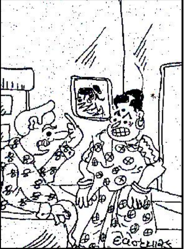
તને પ્રસન્ન રાખવાની ચિંતામાં જ મારા કાળા વાળ ધોળા થઈ ગયા છે !

નવી દિલ્લી, તા. ૧૬ ઈરાકને પાછળ છોડીને રશિયા હવે ભારતનો સૌથી મોટો ઓઈલ સપ્લાયર દેશ બની ગયો છે. રશિયામાંથી ભારતની તેલની આયાત નવેમ્બરમાં સતત પાંચમા મહિને વધીને ૯,૦૮,૦૦૦ બેરલ પ્રતિ દિવસ ડેટા દર્શાવે છે. જે ઓક્ટોબરની સરખામણીમાં ૪ ટકા વધુ છે. સાત દેશોના સમૂહ, ઓસ્ટ્રેલિયા અને યુરોપિયન યુનિયનના ૨૭ દેશોએ પ ડિસેમ્બરથી રશિયાન દરિયાઈ તેલ પર ૬૦ ડોલર પ્રતિ બેરલની મર્યાદા લાદી છે. કારણ