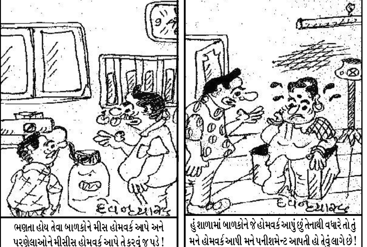
ભણતા હોય તેવા બાળકોને મીસ હોમવર્ક આપે અને પરણેલાઓને મીસીસ હોમવર્ક આપે તે કરવું જ પડે!