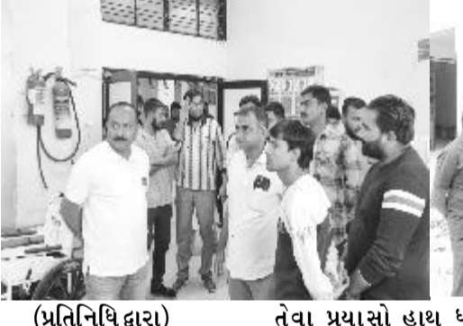
(પ્રતિનિધિ દ્વારા) તેવા પ્રયાસો હાથ ધરવામાં આવી રહ્યા છે તેમ મિડિયા જણાવે છે.