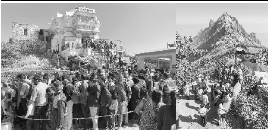
(પ્રતિનિધિ દ્વારા) અને ગિરનાર ક્ષેત્રમાં પાંચ ડીઝી જનતાની ઉભરાતો હતો. જૂનાગઢ તા. ૨૬ તાપમાન હોવા છતાં ગઈકાલે પોતપોતાનાં સંઘ સાથે દૂર દૂરથી ભવનાથ તળેટી વિસ્તાર પ્રવાસી આવેલા ભાવિકો પ્રવાસીઓએ

ધાર્મિક સ્થળો, જોવાલાયક સ્થળોએ દૂર દૂરથી પ્રવાસીઓ આવી પહોંચ્યા : પગપાળા તેમજ રોપ-વેનાં માધ્યમથી અંબાજી માતાજીનાં દર્શને પહોંચેલા ભાવિકો દર્શન કરી ભાવિવભોર થયા