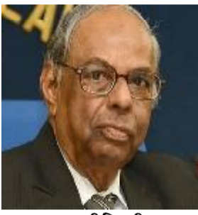
નવી દિલ્હી, તા. ૨૮ ભારતને ૮થી ૯ ટકાનો આર્થિક વિકાસ દર હાંસલ કરતા હજી ૨૦ વર્ષ લાગશે ભારતને પાંચ ટ્રિલિયનની ઈકોનોમી બનાવવી એ ટૂંકાગાળાનો યોગ્ય આશાસ્પદ ગોલ છે. આમ છતાં ભારત માથાદીઠ ૩૪૭૨ ડોલરની આવક સાથે મધ્યમ આવક ધરાવતો દેશ ઓળખાઈ રહ્યો છે તેમ આરબીઆઈનાં પૂર્વ ગવર્નર સી રંગરાજને જણાવ્યું હતું. ભારતે અપર મીડલ ઈન્કમ ધરાવતો દેશ બનવા હજી બે વર્ષ લાંબી મજલ

કાપવી પડશે તેની માથાદીઠ આવક વધારીને ૧૩,૨૦૫ ડોલર કરવી પડશે. ભારતને આ સ્તરે પહોંચવા અને ૮ થી ૯ ટકાનો આર્થિક વિકાસ દર હાંસલ કરતા હજી ૨૦ વર્ષ લાગશે આઈસીએફએઆઈ ફાઉન્ડેશન ફોર હાયર ગ્રોથ એજ્યુકેશનનાં ૧૨ માં પદવીદાન સમારોહને સંબોધતા તેમણે કહ્યું કે, કુલ ઉત્પાદનનાં સંદર્ભમાં ભારત વિશ્વની પાંચમી સૌથી મોટી ઈકોનોમી છે. તે એક સારી સિધ્ધિ છે. જો કે માથાદીઠ આવકની રેન્કમાં મુજબ ૧૮૭ દેશોમાં તેનો ૧૪૨મો નંબર છે. ઉલ્લેખનીય છે કે છેલ્લા વર્ષોમાં ભારતનું અર્થતંત્ર મજબૂત બન્યું છે. નીતિનાં અંગ્રેજી સુધીએ તેમણે ભારતનો ગ્રોથ રેટ વધારવા પર ભાર મુકવાની જરૂર છે. ૮ ટકાનો ગ્રોથ હાંસલ કરવો પાંચ ટ્રિલિયન ઈકોનોમી એ