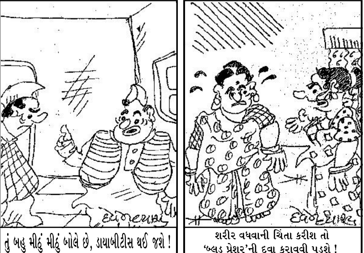
તું બહુ મીઠું મીઠું બોલે છે, ડાયાબીટીસ થઈ જશે ! શરીર વધવાની ચિંતા કરીશ તો ‘બલડ પ્રેશર’ની દવા કરાવવી પડશે !