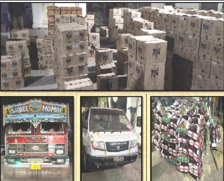
(કાર્થમ રીપોર્ટ દ્વારા) ખુલ્લા ભાગમાંથી વિદેશી દારૂનો મુદામાલ રૂ.૨૪,૫૧,૫૨૦નો જપ્ત કરાયો. આ ઉપરાંત સરકારી પોલીસે ત્રાટકી રૂ.૧૨,૯૭,૫૦૦નો મુદામાલ પણ જપ્ત કરાયો. કુલ મુદામાલની કિંમત રૂ.૩૭,૫૯,૦૨૦ની છે.

ઝફર મેદાનના ખુલ્લા ભાગમાં કટીંગ કરીને દારૂની હેરફેર થાય તે પહેલા પોલીસ ત્રાટકી : કુલ રૂ.૩૭,૫૯,૦૨૦નો મુદામાલ જપ્ત કરાયો