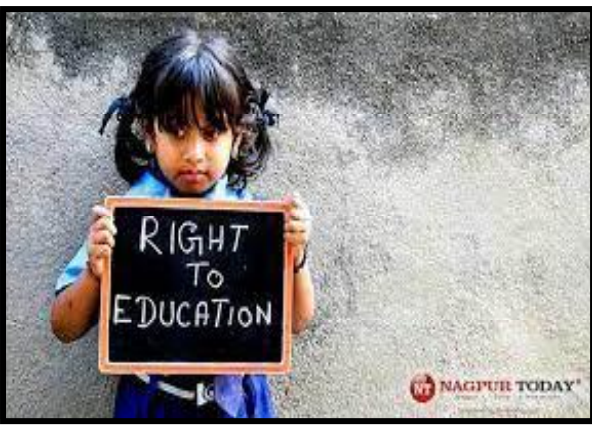
આરટીઈ માટેનું ફોર્મ ઓફિસિયલ વેબસાઈટ ઉપરથી ભરવાનું રહેશે. વેબસાઈટ rte.orggujarat.com છે.

માર્ચથી ૧૧મી એપ્રિલ દરમિયાન અરજી કરવાની રહેશે. આ ઉપરાંત મહત્વની બાબત એ છે કે ધોરણ ૧માં પ્રવેશ મેળવવા માટે બાળકની ઉંમર ૩૧ મે, ૨૦૨૩ના રોજ ૬ વર્ષ પૂર્ણ થઈ ગઈ હોવી જરૂરી છે. વાલીઓએ આરટીઈ માટેનું ફોર્મ ઓફિસિયલ વેબસાઈટ ઉપરથી ભરવાનું રહેશે. વેબસાઈટ rte.orggujarat.com છે. વેબસાઈટ ઉપર ફોર્મ ભરતી વખતે જરૂરી તમામ આધાર પુરાવા રજૂ કરવાના રહેશે.