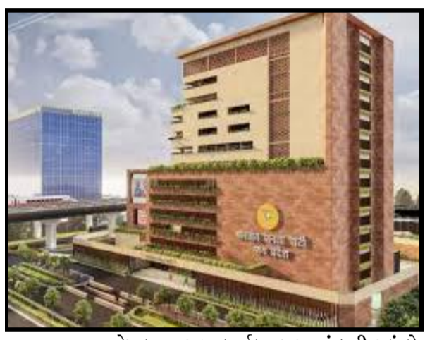
ભોપાલ, તા.૨૮ આ વર્ષના અંતમાં મધ્ય પ્રદેશમાં ચૂંટણીઓ આવી રહી છે, મધ્ય પ્રદેશ ભાજપમાં ઘણું બદલાઈ રહ્યું છે, ભોપાલમાં પાર્ટી

માળનું ૧૯૮૧માં સુંદરલાલ પટવા સરકાર દરમિયાન રૂ.૨ કરોડના ખર્ચ સાથે બનાવવામાં આવ્યું હતું અને તે દેશના સૌથી મોટા પાર્ટી કાર્યાલયો પૈકી એક ગણવામાં આવે છે. બીજેપી ચીફ જેપી નહા નવી ઈમારતનું મધ્યપ્રદેશમાં બીજેપીના નવા કાર્યાલયનું મોડેલ ભૂમિ પૂજન અને શિલાન્યાસ સમારોહ કરશે. મધ્ય પ્રદેશ ભાજપના પ્રમુખ વીડી શમ્ભુએ જણાવ્યું હતું કે, ભાજપે સમગ્ર દેશના દરેક જિલ્લામાં એક કાર્યાલય બનાવવાનું નક્કી કર્યું હતું, તે ભોપાલમાં લાંબા સમયથી પેન્ડિંગ હતું હવે પાર્ટીના કાર્યકરોની જરૂરિયાત મુજબ નવી ઓફિસ