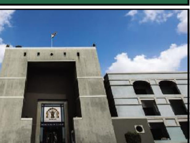
હિતની રિટ અરજીની સુનાવણીમાં આજે મેસર્સ અજંતા પ્રા.લિ (ઓરેવા ગ્રુપ) તરફથી ગુજરાત હાઈકોર્ટે સમક્ષ રજૂઆત કરાઈ હતી કે, તેમના દ્વારા હાઈકોર્ટે અગાઉ પીડિતોને વળતર ચૂકવવા બાબતે કરેલા હુકમ અનુસંધાનમાં ૫૦ ટકા રકમ એટલે કે રૂ. ૭.૩૧ કરોડ

અમદાવાદ, તા. ૨૯ ગુજરાત હાઈકોર્ટના આદેશ મુજબ ઓરેવા ગ્રુપ દ્વારા ગુજરાત રાજ્ય કાનૂની સેવા સત્તામંડળને રૂ. ૭.૩૧ કરોડની રકમ જમા કરવામાં આવી હતી અને આ બાબતે કંપની દ્વારા એફિડેવિટ કરવામાં આવી હતી. ગત તા. ૨૨ ફેબ્રુઆરીના રોજ હાઈકોર્ટે આદેશ કર્યો હતો કે, મોરબી બ્રિજ તૂટી પડવાની દુર્ઘટનામાં મરણ પામેલા લોકોના પરિવારજનોને રૂ. ૧૦ લાખ અને ઈજાગ્રસ્તોને રૂ. ૨ લાખ આપવાનો હુકમ કર્યો હતો. ગત ઓક્ટોબર ૨૦૨૨માં ૧૩૫ લોકોના જીવ લેનાર મોરબી બ્રિજ તૂટી પડવાની ઘટના અંગે શરૂ થયેલી સુઓ મોટો પીઆઈએલ અરજીને લગતી ચાલી રહેલી સુનાવણીમાં ગુજરાત હાઈકોર્ટે વચગાળાના આદેશમાં મેસર્સ અજંતાને આવો વચગાળાની રાહત આપવાનો આદેશ કર્યો હતો. તત્કાલીન ચીફ જસ્ટિસ સોનિયા ગોંડાણી અને જસ્ટિસ સંદીપ એન. ભટ્ટની ખંડપીઠે આદેશ કરતી વખતે નોંધ્યું હતું કે, આ માત્ર પીડિતોને રાહત આપવાનો એક પ્રયાસ છે કારણ કે, તેમનું એક પરિવારજનોના મરણના કારણે તેમનું જીવન સંપૂર્ણપણે ખોરવાઈ ગયું છે. મૃત્યુની ખોટ કોઈ રીતે પૂરી કરી શકતા નથી પરંતુ આ મુતકોના પરિવારજનોને રાહત આપવાનો એક પ્રયાસ છે. દરમિયાન સુઓ મોટો જાહેર