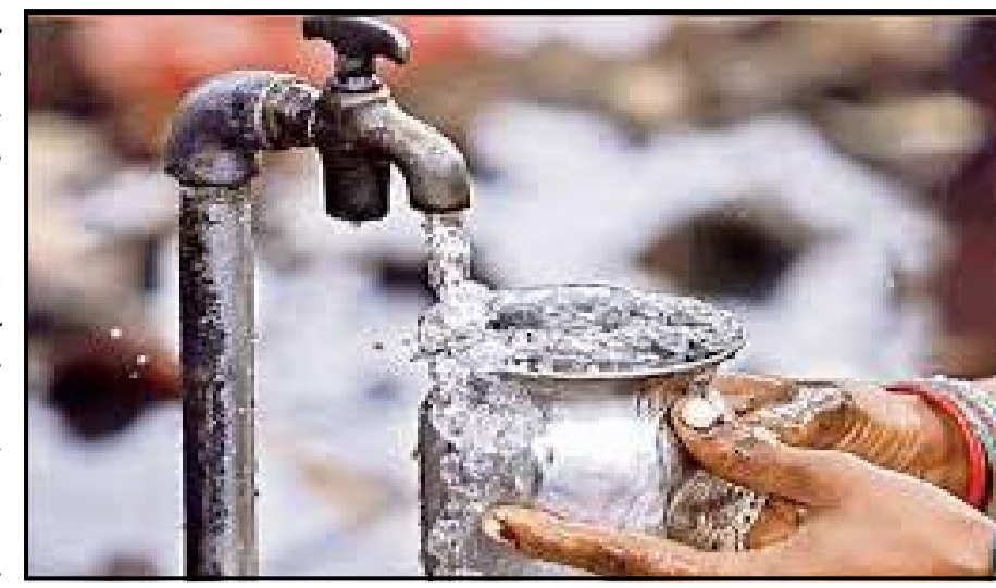
સ્થિતિની વધુ વાસ્તવિકસમજણ સ્વચ્છતા, સારૂ સ્વાસ્થ્ય, સુરક્ષા, આર્થિક સલામતી અને આપવા માટે ૧૦ ક્ષેત્રોમાં જળ પાણીની ગુણવત્તા, પાણીની ઉપલબ્ધતા, પાણીનું મૂલ્ય, અને પ્રેસ રિલીઝ મુજબ, જ્યાં પીવાનું પાણી, પાણીનું સંચાલન અને માનવ ચિંતાજનક રીતે વિશ્વની ૭૮ ટકા

ટકાથી વધુ અથવા ૫.૫ અબજ લોકો પાસે સલામત અને સ્વચ્છ પાણીની એક્સેસ નથી. હાલમાં ચારમાંથી ત્રણ લોકો પાણી-અસુરક્ષિત દેશોમાં રહે છે. ડેનમાર્ક, લક્ઝમબર્ગ, ઓસ્ટ્રિયા, નોર્વે, સ્વિટ્ઝર્લેન્ડ, ફિનલેન્ડ અને આઈસલેન્ડ જેવા અન્ય યુરોપિયન દેશોની સાથે, આયર્લેન્ડ, ફ્રાન્સ, લિથુઆનિયા, ગ્રીસ, જર્મની, યુકે, એસ્ટોનિયા, ઈટાલી, લાતવિયા, સ્પેન, સ્લોવેકિયા, સ્લોવેનિયા, કોએશિયા, ચેકિયા, હંગેરી, અને પોર્ટુગલને અ અહેવાલમાં ઉચ્ચ સ્તરની જળ સુરક્ષા સાથેના દેશ તરીકે સ્થાન આપવામાં આવ્યું છે. અમેરિકામાં વોટર-સિક્યોર કેટેગરીમાં માત્ર કેનેડા અને