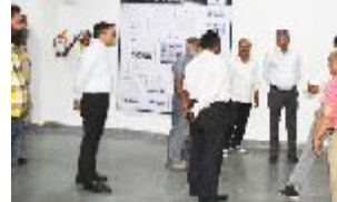
(પ્રતિનિધિ દ્વારા) રાજકોટ તા. ૨૬ ભારતના ચૂંટણી પંચની સૂચના મુજબ, ઈ.વી.એમ.-વી.વી.પેટ વેરહાઉસની સ્થિતિનું દર ત્રણ માસે આંતરિક નિરીક્ષણ કરવાનું હોય છે.