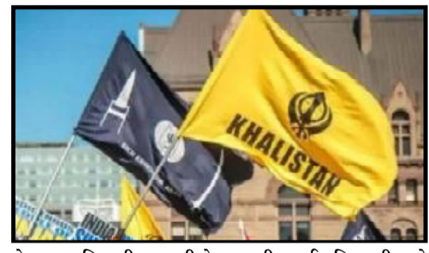
એલર્ટ છે. તેજ સમયે, હવે પ્રગતિ મેદાનમાં પાલિસ્તાની સમર્થકો તરફથી ધમકીઓ મળ્યા બાદ, દિલ્હી પોલીસે તપાસ તેજ કરી દીધી છે. પોલીસે જણાવ્યું કે મેસેજમાં કથિત પાલિસ્તાન સમર્થકો પ્રગતિ મેદાન ઉપર હટાવવાની વાત કરી રહ્યા હતા. બાદમાં આ વ્યક્તિએ 'વારિસ પંજાબ દે ના ચીફ અમૃતપાલ સિંઘ વિશે પણ કથિત રીતે વાત કરી હતી. તેમણે કહ્યું કે ઈન્દિરા ગાંધી એરપોર્ટ પોલીસ સ્ટેશનમાં ઈન્ડિયન પીનલ કોડની કલમ ૧૫૩ (હુલ્લડો કરાવવાના ઈરાદા સાથે ઉચ્કેરણી), 153A (ધર્મ વગેરેના આધારે વિવિધ જૂથો વચ્ચે દુશ્મનાવટને પ્રોત્સાહન આપવી) અને ૫૦૫ (જાહેર દુષ્કર્મ) ની નોંધણી કરવામાં આવી હતી. નિવેદન આપતા) નોંધાયેલ છે. અધિકારીએ કહ્યું કે આ મામલો દિલ્હી પોલીસના સ્પેશિયલ કરાયેલી કાર્યાલયીથી ચોંકી સેલને ટ્રાન્સફર કરવામાં આવ્યો છે. આ મહિનાની ૪ તારીખે હરિયાણાના અંબાલા જિલ્લામાં અમૃતસર-દિલ્હી નેશનલ હાઈવે ઉપર બનેલા પુલ ઉપર પાલિસ્તાની ઝંડો જોવા મળ્યો હતો. આ મામલે અજાણ્યા સામે ગુનો નોંધવામાં આવ્યો હતો. પોલીસે જણાવ્યું હતું કે અંબાલા શહેર નજીક શંભુ ટોલ પ્લાઝા પાસે બનેલા પુલ ઉપર પાલિસ્તાનના સમર્થનમાં નારા પણ લખેલા જોવા મળ્યા હતા. આ અંગે કેસ નોંધવામાં આવ્યો છે. એટલું જ નહીં પાલિસ્તાની સમર્થક અમૃતપાલ ઉપર કરાયેલી કાર્યાલયીથી ચોંકી ઉઠેલા સમર્થકોએ લંડનમાં

નવી દિલ્હી તા. ૨૯ દિલ્હી પોલીસે કથિત રીતે ઓડિયો મેસેજ રેકોર્ડ કરવા અને પ્રસારિત કરવા બદલ અજાણ્યા વ્યક્તિઓ વિરૂદ્ધ કેસ નોંધ્યો છે. ઓડિયોમાં પ્રગતિ મેદાનમાંથી ભારતીય ધ્વજ હટાવવાની ધમકી આપવામાં આવી હતી, જ્યાં સપ્ટેમ્બરમાં G20 સમિતિ યોજાવાની છે. આ કેસ એક વ્યક્તિની ફરિયાદ ઉપર નોંધવામાં આવ્યો છે જેને દિલ્હી એરપોર્ટ ઉપર તેના આગમન ઉપર તેના ફોન ઉપર આ પૂર્વ રેકોર્ડ કરાયેલ સંદેશ મળ્યો હતો. G-20 મીટિંગનો મોટો કાર્યક્રમ સપ્ટેમ્બરમાં પ્રગતિ મેદાનમાં યોજાવાનો છે. દિલ્હીના આ પ્રગતિ મેદાનમાં જી-૨૦ સંબંધિત ઘણી બેઠકો યોજાવાની છે. જેને લઈને પ્રગતિ મેદાનમાં પણ તૈયારીઓ પૂરજોશમાં ચાલી રહી છે. આ દરમિયાન વિશ્વના ટોચના નેતાઓ આ બેઠકમાં ભાગ લેશે. જી-૨૦ મીટિંગને લઈને દિલ્હી પોલીસ પહેલેથી જ