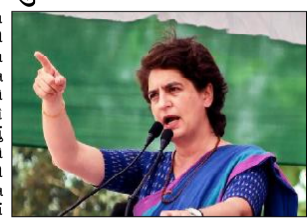
ભાજપને જાણ થઈ કે તે પપ્પુ નથી અને લાખો લોકો તેમની સાથે ચાલી રહ્યા છે, ત્યારે તેઓ

નવી દિલ્હી તા. ૨૯ કોંગ્રેસના મહાસચિવ પ્રિયંકા ગાંધી વાણીએ તેમના ભાઈ અને કોંગ્રેસના ભૂતપૂર્વ સાંસદ રાહુલ ગાંધીને 'મોદી અટક' બદનક્ષી કેસમાં દોષી ઠેરવ્યા બાદ બે વર્ષની જેલની સજા માટે કેન્દ્ર અને વડાપ્રધાન નરેન્દ્ર મોદીની નિક્ષણ ઝાટકણી કાઢી હતી. ભારતીય જનતા પાર્ટી અને મોદી ઉપર ભારે પ્રહાર કરતા પ્રિયંકા ગાંધીએ રાજધાન પર કોંગ્રેસના નેતાઓ દ્વારા આયોજિત સત્યાગ્રહને સંબોધિત કરતા,