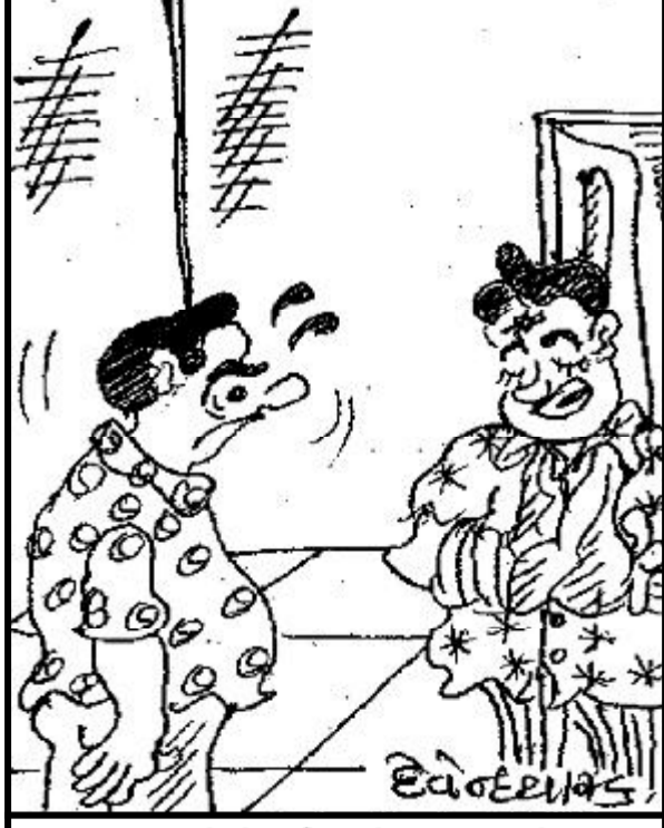
ઘરવાળીની શક્તિની દવા કરાવી, તો મારી જ દવા થઈ ગઈ!