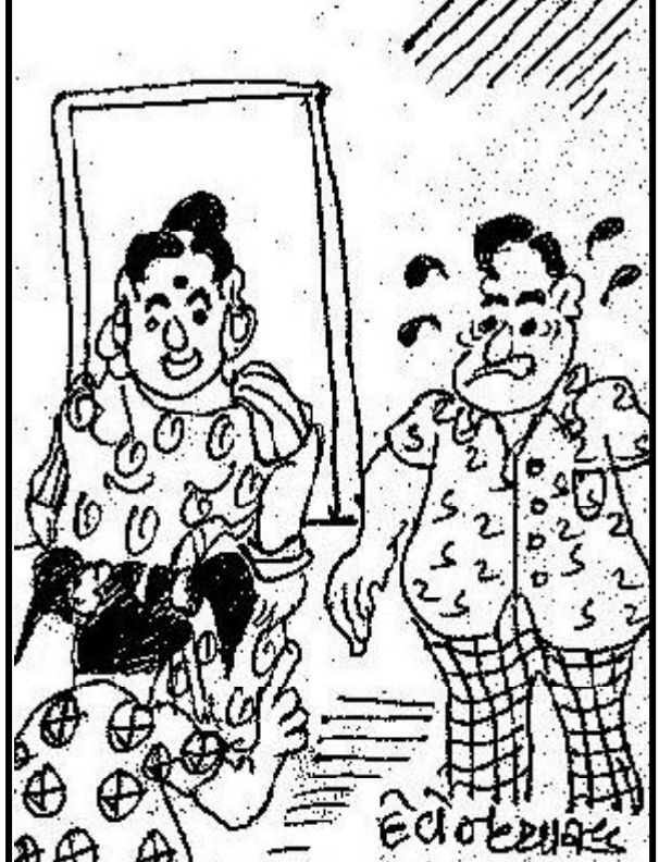
અંદરો-અંદર ઝગડો ન કરો, આ અઠવાડિયે પપ્પા માડું હોમવર્ક કરી આપશે અને આવતા અઠવાડિયે મમ્મી!