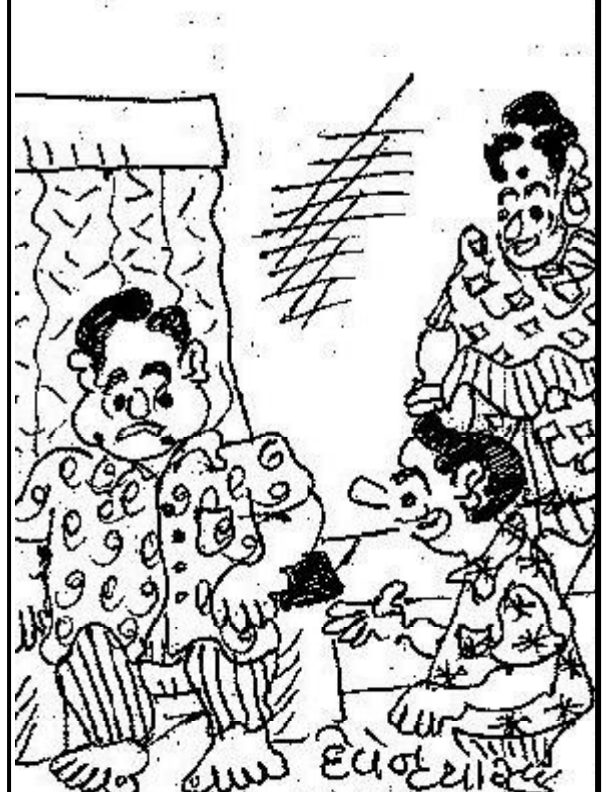
પપ્પા સ્કુલમાં મીસ એટલું બધું હોમવર્ક આપે છે કે, એની ચિંતામાં હું સુખેથી ભોજન પણ નથી કરી શકતો!