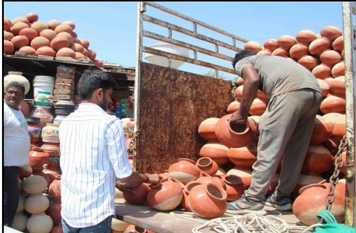
ઉનાળાની ગરમીમાં માટીના માટલાની ખરીદી વધારે થાય છે ત્યારે વેપારીઓ માટલાનો સ્ટોક વધારી રહ્યા છે.