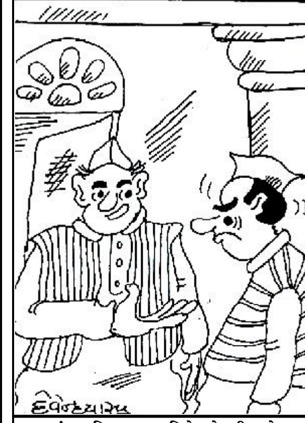
વારંવાર વિવાદાસ્પદ નિવેદનો કરી અને ગીનીલ બુકમાં નામ નોંધવા માગતો લાગે છે !