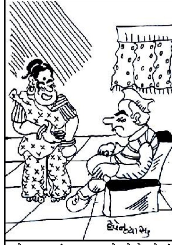
લોકસભામાં બરાડા પાડો છો ને ઘરેમાં અવાજ પણ નથી નીકળતો !