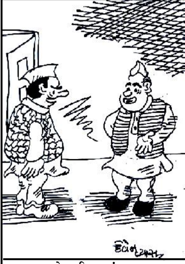
ભણતા ત્યારે હાઈસ્કૂલમાં હડતાલ કરતા, હવે સંસદની કાર્યવાહી ખોરવીએ છીએ !

(કુંજન રાડિયા દ્વારા) જામ ખંભાળિયા તા.૧૨ છેલ્લા કેટલાક દિવસોથી સમગ્ર દેશમાં કોરોનાનું સંક્રમણ દિવસે દિવસે વધી રહ્યું છે. ત્યારે કેન્દ્ર સરકાર આ સંદર્ભે એક્શન મોડમાં આવી છે. જેના અનુસંધાને ગઈકાલે સોમવારે સમગ્ર રાજ્યની તમામ સરકારી હોસ્પિટલમાં કોવિડ મોકડીલનું આયોજન કરવામાં આવ્યું હતું. જેના ભાગરૂપે દેવભૂમિ દ્વારકા જિલ્લાના મુખ્ય મથક ખંભાળિયામાં આવેલી સરકારી સિવિલ હોસ્પિટલના કોવિડ વિભાગમાં મોકડીલ યોજવામાં આવી હતી. જેમાં ખાસ કરીને કોરોના સામેની તૈયારીના