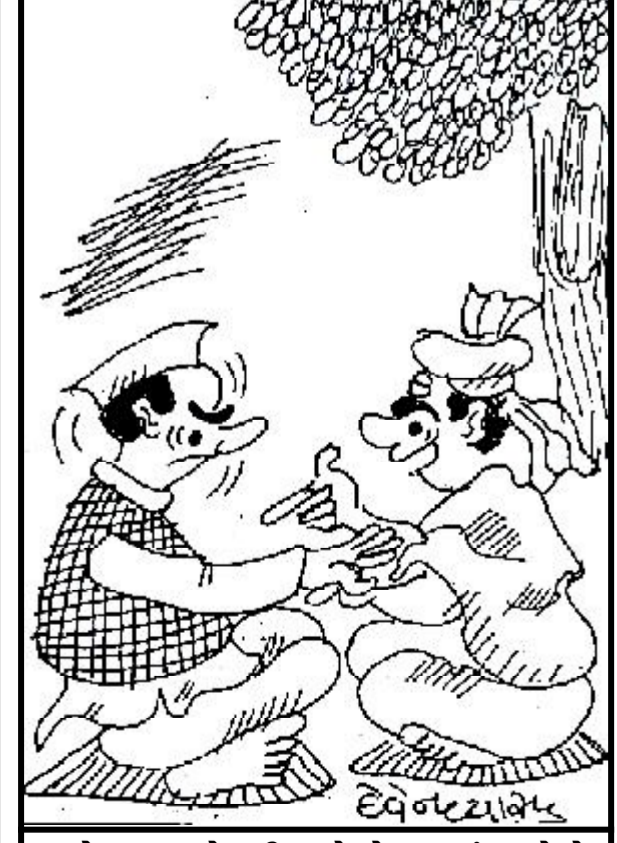
તમે પક્ષપલ્ટો કરી અને જે પક્ષમાં જશો તે પક્ષની હાલત બગડી જશે !