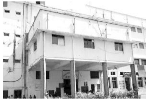
પાર્ટીના લોકોને લોકોના પ્રશ્નો માટે રોડ, રસ્તા, ગટર, પાણી જેવા પ્રશ્નો નજરે નથી આવતા માત્રને માત્ર રાજકીય રાગદેશ રાખીને વિરુદ્ધ, નિમણુંકની સમયમર્યાદા વિન્યા પછી આવા નિર્ણય કરવા માટે જનરલ બોર્ડ બોલાવવું કેટલા અંશે વ્યાજબી છે કે માત્રને માત્ર વિપક્ષનો અવાજ દબાવવા માટે આવી કોશીષ કરવામાં આવી રહી છે. કોંગ્રેસ