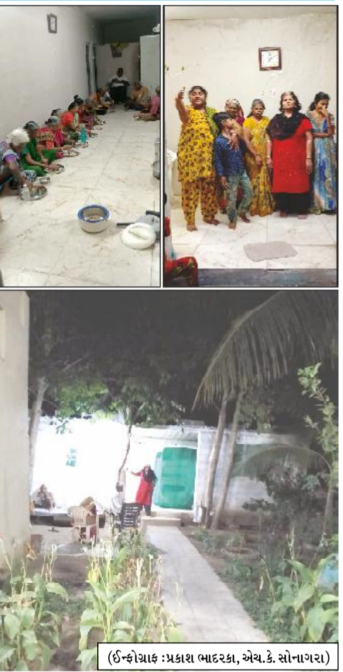
(ઈન્ફોગ્રાફ : પ્રકાશ ભાદરકા, એચ.કે. સોનાગરા)

અમદાવાદ તથા મુંબઈનાં દાતાઓ તરફથી આ સંસ્થાને વોશીંગ મશીન, પલંગ, કબાટ, ગાદલા તથા જરૂરી ચીજવસ્તુઓ પુરી પાડવામાં આવેલ છે. તેમજ જૂનાગઢનાં દાતાઓ તથા લંડનનાં દાતાઓ તરફથી સંસ્થાને ફીઝ તથા એરકુલરની સુવિધા પુરી પાડવામાં આવી રહી છે. આ ઉપરાંત જૂનાગઢ ખાતે આવેલા એવન સ્ટુડીયો તરફથી સંસ્થાને વોટર કુલરની ભેટ પણ આપવામાં આવી છે. કોઈપણ જાતનાં ભેદભાવ વિના અહીં આશ્રય લેનાર વડીલોને બે ટાઈમ યાનાસ્તા, તેમજ શુધ્ધ સાત્વીક ભોજન આપવામાં આવે છે. ઉપરાંત અહીં રહેતા વડીલોને દર્શનાર્થે પણ લઈ જવામાં આવે છે. સંસ્થામાં જ રમત-ગમત, અંતાશરી સહિતની જુદી જુદી રમતો સાથેની રમતગમતની પ્રવૃત્તિ પણ કુરસદનાં સમયે કરવામાં આવે છે. 'સ્વીટ હોમ' જે નામકરણ છે તો સાચું જ આ સંસ્થામાં વડીલોને 'સ્વીટ હોમ'ની અનુભૂતિ થઈ રહી છે. આ સંસ્થાનાં સંચાલકો દ્વારા ભવિષ્યની યોજનાની રૂપરેખા આપતા જણાવ્યું હતું કે વડીલોને આશ્રય આપતી આ સંસ્થામાં હજુ પણ વિવિધ સુવિધાઓ ઉભી કરવાની છે અને તેનાં માટે દાતાઓનો સહયોગ જરૂરી છે. અમારી સંસ્થાને મળતું દાન તે કરમુકત છે તેમ પણ જણાવ્યું હતું.