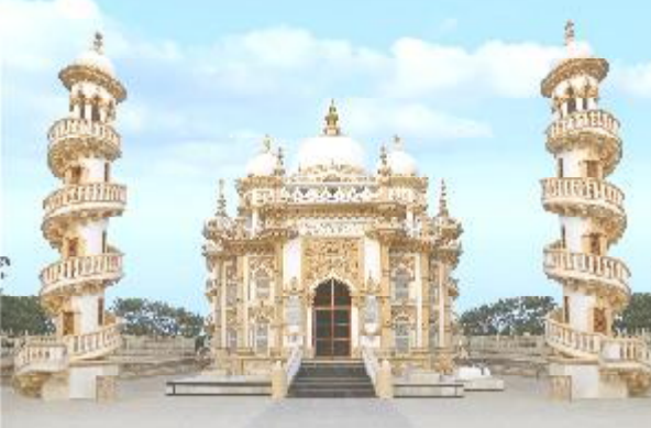
જૂનાગઢ જિલ્લામાં કેન્દ્ર અને રાજ્ય રક્ષિત કુલ ૪૬ હેરિટેજ સ્થળો

ઉપરકોટ જૂનાગઢ શહેરમાં ઈતિહાસ પ્રસિધ્ધ ઉપરકોટનો કિલ્લો આવેલ છે. આ કિલ્લાનું મુળ નામ ગિરિદુર્ગ હતું. ઉપરકોટનો કિલ્લો મોર્ય