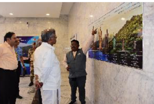
વિઝીટ બુકમાં અભિપ્રાય ટાંકતા અખંડ ભારતના શિલ્પી સરદાર સાહેબના કાર્યોને બિરદાવ્યા : ભાવિ પેઢી તેમાંથી પ્રેરણા લે તે માટે શૈક્ષણિક ટૂર ગોઠવાય તેવી હિમાયત પણ કરી

સરદાર સાહેબની ફોટો ગેલેરી, પ્રદર્શનકક્ષ, ઓડિયો વિઝ્યુઅલ દ્વારા ઐતિહાસિક ઘટનાઓનું આભેદુલ્લ વર્ણન અને દેશની એકતા અખંડિતતામાં આપેલું યોગદાન પ્રસ્તુત કરવામાં આવે છે. એટલું જ નહીં વ્યૂઝિંગ ગેલેરી દ્વારા સરદાર સરોવર ડેમના દર્શન અને નર્મદા મૈયાના દર્શન, પ્રાકૃતિક નજારો જોઈને સૌ કોઈ મંત્રમુગ્ધ બની જાય છે. રાજ્યપાલશ્રીએ પણ આ પ્રત્યેક બાબતોને બારીકાઈથી નજરે નિહાળી ખૂબ પ્રશંસા કરી હતી. સ્ટેચ્યુ નિર્માણ અને ટ્રિવિંટ વાડા પ્રધાનશ્રી નરેન્દ્રભાઈ મોદીની ખૂબ જ પ્રશંસા કરી હતી. સાથે માન. રાજ્યપાલશ્રીએ કામરુન (આફ્રિકા)ના પ્રવાસીઓ સાથે વાર્તાલાપ પણ કર્યો હતો. વિદેશી પ્રવાસીઓએ માન.