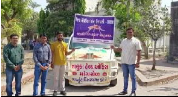
(નિલેશ રાજપરા દ્વારા) લીમડાચોક સહીત શહેરના મુખ્ય માર્ગો પર ફરી હતી. છેલ્લા એક અઠવાડિયાથી મલેરિયા નાબૂદી માટે આરોગ્ય વિભાગ દ્વારા મલેરિયા નાબૂદી સમાહ તરીકે ઉજવણી કરવામાં આવી હતી જેમા મલેરિયા બાબતે જનજાગૃતીના વિવિધ કાર્યક્રમો યોજવામાં આવ્યા હતા ત્યારે આજરોજ વિશ્વ મલેરિયા દિવસ સંદર્ભે યોજવામાં આવેલી રેલીમાં મલેરિયાની બાબત મા લોકોમાં જાગૃતતા આવે એવા સૂત્રો બોલાવવામાં આવ્યા સાથે લોકોને મલેરિયા સામે લડવા ઉપાયો સમજાવવામાં આવ્યા હતા.. આ રેલીમાં આરોગ્ય વિભાગના અધિકારીઓ ડોક્ટર ડાભી સાહેબ સહિત ના ડોક્ટરો સહીત કર્મીઓ જોડાયા હતા.

રાજપીપલા તા. ૨૬ ઓથોરિટી દ્વારા બુકે આપી ગુજરાત રાજ્યના સ્ટેટ ગેસ્ટ બનેલા નાગાલેન્ડ રાજ્યના મહામહિમ રાજ્યપાલશ્રી લા. ગણેશન દિલ્હીથી હવાઈ માર્ગે વડોદરા ખાતે આવી પહોંચ્યા હતા. તા. ૨૫/૦૪/૨૦૨૩ના રોજ વડોદરાથી કેવડિયા એકતાનગર ખાતે બાયરોડ આવી પહોંચતા કેવડિયા વીવીઆઈપી સર્કિટ હાઉસ ખાતે પ્રોટોકોલ અધિકારીશ્રી એન.એફ.વસાવા અને સ્ટેચ્યુ ઓફ યુનિટી નિહાળી ભાવવિભોર બન્યા હતા. સ્ટેચ્યુ ઓફ યુનિટીના પાસગાઈડ દ્વારા અંગ્રેજી, હિન્દી અને સંસ્કૃત ભાષામાં ઐતિહાસિક ઘટના અને સ્ટેચ્યુ ઓફ યુનિટીના નિર્માણ કાર્યોની માહિતીથી મહામહિમશ્રી રાજ્યપાલને અવગત કર્યા હતા. ભારતમાં તાજમહેલ અને સરદાર સાહેબની મૂર્તિ એ એક અજાયબી છે તેમ જણાવ્યું હતું અને લાખોની સંખ્યામાં અહીં દેશ વિદેશના પ્રવાસીઓ કેવડિયા ખાતે મુલાકાત લે છે. તેઓ તેને યાદગાર ઘણો માને છે. વિશાળ પ્રતિમાને જોઈને લોકો અચંબામાં પડી જાય છે.