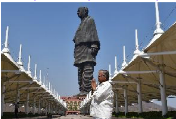
સરદાર સાહેબની સૌથી ઊંચી પ્રતિમાના દર્શન કરી ચરણસ્પર્શ કરી ધન્યતા અનુભવી સરદાર સાહેબના જીવન કવન અને ઐતિહાસિક ઘટનાઓનું ઝીણવટપૂર્વક નિરીક્ષણ કર્યું: પ્રધાનમંત્રીશ્રી નરેન્દ્રભાઈ મોદીના વિઝનની ભારોભાર પ્રશંસા કરી એક ભારત શ્રેષ્ઠ ભારતનું સ્વપ્ન સાકાર થતું નજરે નિહાળ્યું