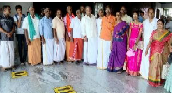
રાજ્યપાલશ્રી સાથે યાદગાર તસવીરો પણ ખેંચાવી હતી. તમિલનાડુના કેટલાક પ્રવાસીઓ સરદાર સાહેબની ગેલેરીમાં અચાનક તમિલનાડુનાં પ્રવાસીઓ ઓળખાઈ જતાં મલકના માનવી મળ્યા ત્યારે હરખની ખુશી બેવડાઈ ગઈ હતી અને તેમની સાથે પણ તસવીરી ઝલક લીધી હતી અને પ્રવાસીઓ પણ પોતાના કેમેરામાં તસવીરો ખેંચાવી પ્રવાસને યાદગાર બનાવ્યો હતો. સ્ટેચ્યુ ઓફ યુનિટી નિહાળી બહાર આવ્યા પછી માન. રાજ્યપાલશ્રીએ સરદાર સાહેબના ચરણ સ્પર્શ કરી ધન્યતા અનુભવી હતી. વિઝીટ બુકમાં અખંડ ભારતના શિલ્પી સરદાર સાહેબના કાર્યોને બિરદાવ્યા હતા અને ભાવિ પેઢી તેમાંથી પ્રેરણા લે તેના માટે શૈક્ષણિક ટૂર ગોઠવીને વધુ લોકોને