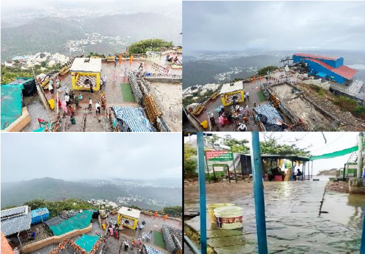
જૂનાગઢ ગીરીવર ગિરનાર ઉપર આજે વહેલી સવારે વરસાદનું જોરદાર જાપટુ પડ્યું હતું. કમોસમી માવઠાથી પાણી વહેતા થયા હતા.

જૂનાગઢ જીલ્લામાં અડધાથી દોઢ ઈંચ કમોસમી વરસાદ : રસ્તા ઉપર પાણી ફરી વળ્યા : કેરીનાં પાકને ભારે નુકશાન