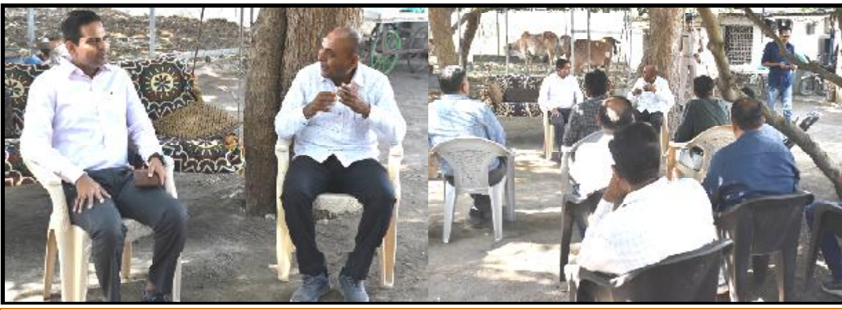
કલેક્ટર અનિલકુમાર રાણાવસિયાએ પ્રાકૃતિક ખેતીની મુહિમને આગળ વધારવા ખેડૂતની વાડીએ અધિકારીઓ સાથે બેઠક યોજી

જૂનાગઢ, તા. ૨૯ કલેક્ટરે છેલ્લા એક દાયકાથી કલેક્ટર અનિલકુમાર રાણાવસિયાએ જૂનાગઢ જિલ્લામાં પ્રાકૃતિક ખેતીના વ્યાપ વધારવા માટે પ્રાકૃતિક ખેતી કરતા ખેડૂતની વાડીએ આત્મા-ખેતી વાડીના અધિકારીઓ સાથે બેઠક યોજી, પ્રાકૃતિક ખેતીની મુહિમને તેજથી આગળ વધારવા માટે અધિકારી-કર્મચારીઓ સાથે પરામર્શ કર્યો હતો. કલેક્ટરે પ્રાકૃતિક ખેતી પ્રાપ્ત થયેલા હકારાત્મક પરિણામો જાણકારી મેળવી હતી. સાથે જ પ્રાકૃતિક ખેતીમાં અવરોધ રૂપ રહેલા પરિબળો વિશે પણ અધિકારીઓ સાથે વિશદ ચર્ચા કરી હતી.