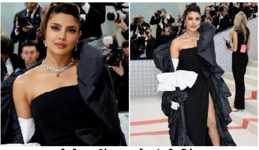
કરોડો નહીં અરબોમાં છે કિંમત

મુંબઈ, ન્યૂયોર્ક શહેરમાં પહેલી મેથી દુનિયાના સૌથી પ્રતિષ્ઠિત ફેશન ઈવેન્ટમાંથી ગણાતા એક મેટ ગાલા ૨૦૨૩ની શરૂઆત થઈ ગઈ છે. જેમાં બોલિવૂડ એક્ટ્રેસિસે પણ ભાગ લીધો છે, જેમાંથી એક પ્રિયંકા ચોપરા છે. એક્ટ્રેસે ઈવેન્ટના પહેલા જ દિવસે પતિ નિક જોનસ સાથે રેડ કાર્પેટ પર એન્ટ્રી મારી હતી. આ વખતની થીમ 'કાર્લ લેગરફેલ્ડ: એ લાઈન ઓફ બ્યૂટી' છે, ત્યારે કપલે દિવંગત ડિઝાઈનર કારલ લેગરફેલ્ડને શ્રદ્ધાંજલિ આપતાં તેમના ફેવરિટ બ્લેક કલરના આઉટફિટમાં દિવનિંગ ક્યુ હતું. પ્રિયંકા અને નિક તેમની દીકરી માલતી મેરી તેમજ પાલ્તુ શ્યાન ડાયેનાને પણ સાથે લઈ ગયા છે. ઈવેન્ટ દરમિયાનની બંનેની કેટલીક તસવીરો ઈન્સ્ટાગ્રામ પર વાયરલ થયા છે. પ્રિયંકા ચોપરાએ તેના ઈન્સ્ટાગ્રામ પર રેડ કાર્પેટ પર