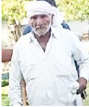
(રાકેશ સામાણી દ્વારા) કલ્યાણપુર તાલુકાના ભોગાત ગામે ગૌશાળામાં

ગૌમાતા સાથે સૃષ્ટિ વિરુદ્ધનું કૃત્ય આચરનાર વૃદ્ધનો સોશિયલ મીડિયામાં વિડીયો વાઈરલ થયા બાદ સમગ્ર મામલે દેવભૂમિ દ્વારા કા જિલ્લામાં ભારે ઉદાપોહ મચ્યો હતો. ત્યારે ગૌ સેવકોમાં આરોપી વિરુદ્ધ ભારે રોષની લાગણી જોવા મળી હતી. ભોગાતમાં ગૌશાળામાં ગૌમાતા સાથે સૃષ્ટિ વિરુદ્ધનું કૃતિ આચરનાર આરોપીનો સોશિયલ મીડિયામાં આ વિડીયો વાયરલ થયા બાદ આ સમગ્ર મામલે સમગ્ર ગુજરાતમાં ઘેરા પ્રત્યાઘાતો પડ્યા હતા. ત્યારે આ સમગ્ર મામલે દ્વારકા અને ભોગાત ગામેથી બહોળી સંખ્યામાં ગૌ ભક્તો કલ્યાણપુર પોલીસ મથકે પહોંચ્યા હતા. આરોપીને કડક કડક સજા થાય તેવી માંગ સાથે ગૌ સેવકોએ પોલીસ સ્ટેશનને રજૂઆત કરી હતી. પોલીસે આરોપી શખ્સને ઝડપી આરોપી વિરુદ્ધ વિવિધ કલમ ૩૭૭ તેમજ ૧૧(૧) મુજબ ગુનો નોંધી આરોપી ધાના