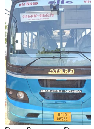
વિભાગીય નિયામક કોડીનારની જનતાને ન્યાય આપશે તે તો સમય જ બતાવશે.