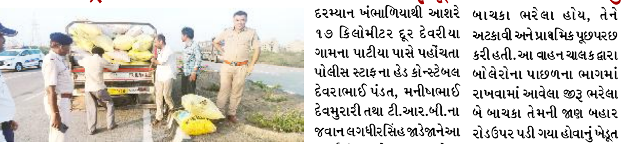
(કુંજન રાડિયા દ્વારા) પી.એસ.આઈ. એન.ડી. કલોતરા તથા સ્ટાફ દ્વારા અત્રે જામખંભાળિયા તા. ૩૦ દેવભૂમિ દ્વારકા જિલ્લા જામનગર હાઈવે ઉપર હાથ ધરવામાં આવેલા પેટ્રોલિંગ