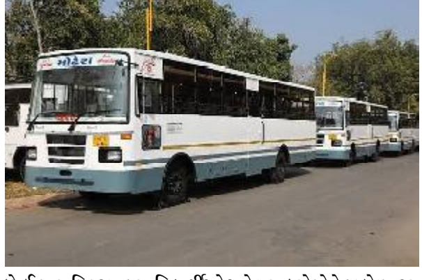
છે. ઈ-પાસ સિસ્ટમ દ્વારા વિદ્યાર્થીઓ અને મુસાફરો પોતે જ કોમ્પ્યુટર અથવા મોબાઈલ દ્વારા રજીસ્ટ્રેશન કરાવી શકાય છે. રજીસ્ટ્રેશન કરાવ્યા બાદ ટૅનિક મુસાફરોને ઓનલાઈન કે ઓફલાઈન પેમેન્ટનું ઓપ્શન આપવામાં આવશે. વિદ્યાર્થીઓના કિસ્સામાં રજીસ્ટ્રેશન કરાવ્યા બાદ આ એપ્લિકેશનનું વેરિફિકેશન પણ જે તે શૈક્ષણિક સંસ્થા દ્વારા ઓનલાઈન કરવામાં આવશે ત્યારબાદ ઓનલાઈન અથવા ઓફલાઈન પેમેન્ટનો વિકલ્પ આપવામાં આવશે. નિગમ દ્વારા હાલમાં પાસ વેરિફિકેશન માટે નિગમના પ્રીન્ટીંગ પ્રેસમાં છપાતી પ્રીપ્રીન્ટેડ સ્ટેશનરી પર પ્રિન્ટ આપવાની થતી હોવાથી ચુકવણી કર્યા બાદ વિદ્યાર્થીઓ અને મુસાફરો નિગમના કોઈ પણ કાઉન્ટર પરથી પાસની પ્રિન્ટ મેળવી શકશે.

ગાંધીનગર, તા. ૧૦ રાજ્યમાં વિદ્યાર્થીઓ અને મુસાફરો માટે રાહતના સમાચાર આવી રહ્યા છે. આગામી દિવસોમાં રાજ્યમાં ઈ પાસ સિસ્ટમ લાગુ કરવામાં આવશે. ૧૨ જૂનના રોજ રાજ્યમાં કન્યા કેળવણીની ઉજવણીથી નવી ઈ- પાસની સિસ્ટમ અમલ કરવામાં આવશે. અંદાજે ૨.૩૨ લાખ મુસાફરો તથા ૪.૮૨ લાખ વિદ્યાર્થીઓને ફાયદો થશે. વિદ્યાર્થીઓને પાસ મેળવવા માટે લાંબા સમય સુધી લાઈનમાં ઉભા રહેવું પડે છે. છતાં પણ વિદ્યાર્થીઓ અને મુસાફરોને હાલાકિનો સામનો કરવો પડે છે. રાજ્યમાં વિદ્યાર્થીઓ અને રોજીંદા મુસાફરોને નિગમ દ્વારા હાલની પાસ સિસ્ટમમાંથી પાસ આપવામાં આવે છે. હાલમાં કાર્યરત સિસ્ટમ મુજબ વિદ્યાર્થીઓએ નિગમના કાઉન્ટર પરથી અરજી પત્રક મેળવવાનું હોય છે. ત્યારબાદ આ અરજી પત્રક મેન્યુઅલી ભરવાનું રહે છે. અરજી પત્રક ભર્યા બાદ જે તે શૈક્ષિક સંસ્થાના સહી સિક્કા કરાવવાના રહે છે. ત્યારબાદ નિગમના કાઉન્ટર પર એપ્લિકેશન ફોર્મ આપી રોકડ ચુકવણી કર્યા બાદ પાસ મેળવી શકાય છે. આ કામગીરીમાં વિદ્યાર્થીઓને અલગ અલગ જગ્યાએ લાઈનમાં ઊભા રહી કામગીરી કરવાનું હોય તેમના કીમતી સમયનો વ્યય થાય છે. નિગમના રોજિંદા મુસાફરો અને વિદ્યાર્થીઓને લાઈનમાં ઊભા રહેવું ન પડે અને ઓનલાઈન પેમેન્ટ તેમજ વિદ્યાર્થીઓના ઈ-વેરિફિકેશન થકી તુરંત જ પાસ મેળવી શકાય તેવા હેતુથી ચાલુ શૈક્ષણિક સત્ર દરમિયાન ઈ- સિસ્ટમ અમલમાં મૂકવામાં આવે