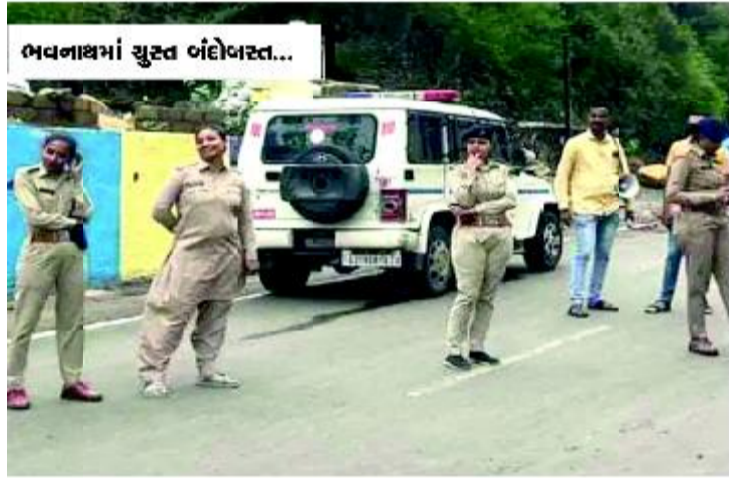
ભવનાથમાં સુસ્ત બંદોબસ્ત...