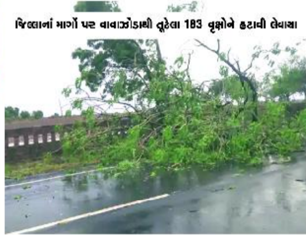
જિલ્લાનાં માર્ગો પર વાવાઝોડાથી તુટેલા 183 વૃક્ષોને હટાવી લેવાયા