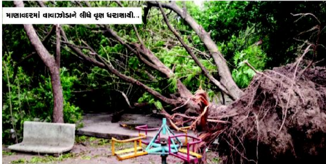
માસાલદરમાં વાવાઝોડાને લીધે વૃક્ષ ધરાશયી...