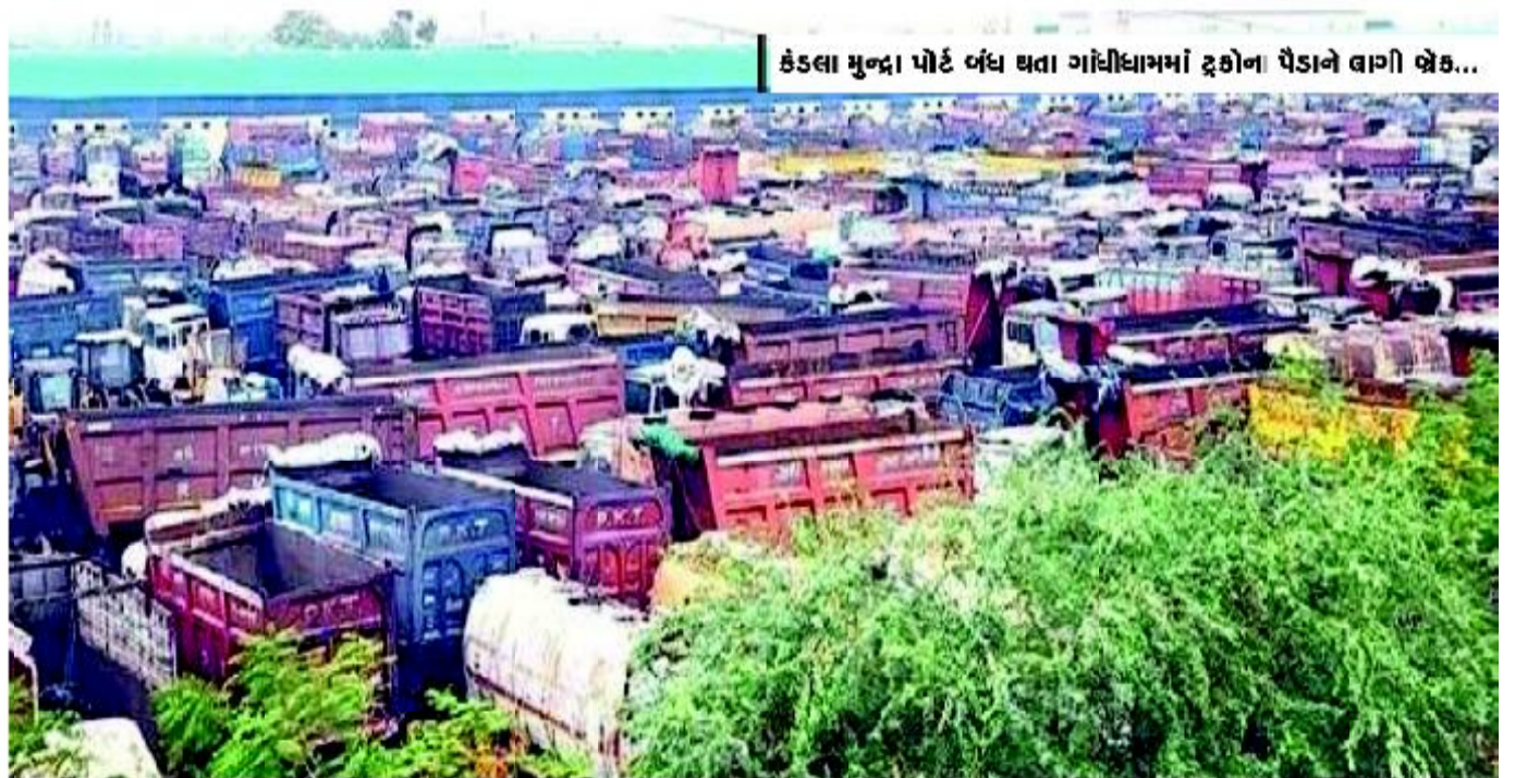
કંડલા મુન્દ્રા પોર્ટ બંધ થતા ગાંધીધામમાં ટ્રકોના પેડાને લાગી બેઠા...