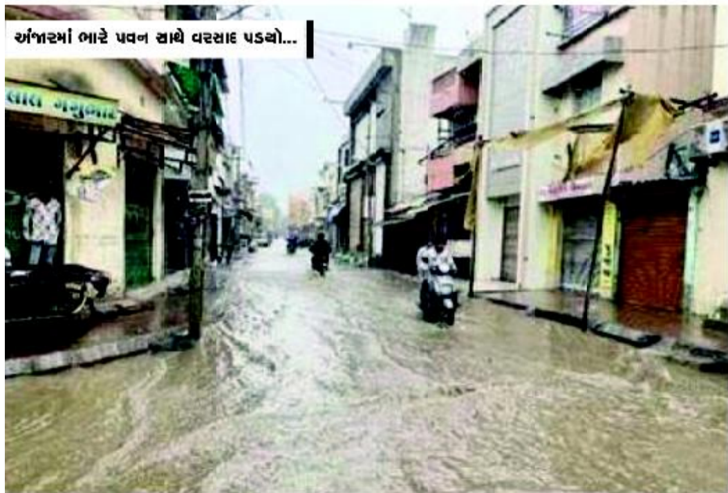
અંજારમાં ભારે પવન સાથે વરસાદ પડ્યો...