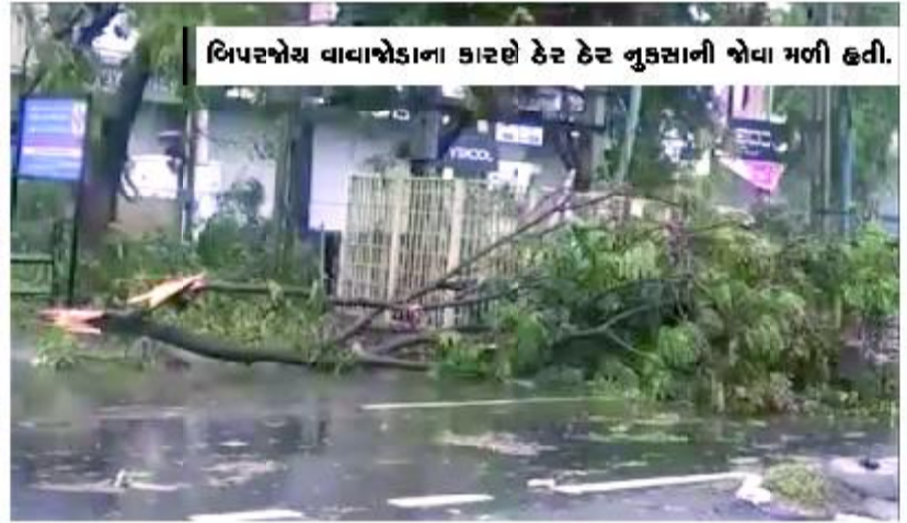
બિપરબોય વાવાઝોડાના કારણે ઠેર ઠેર નુકસાની જોવા મળી હતી.