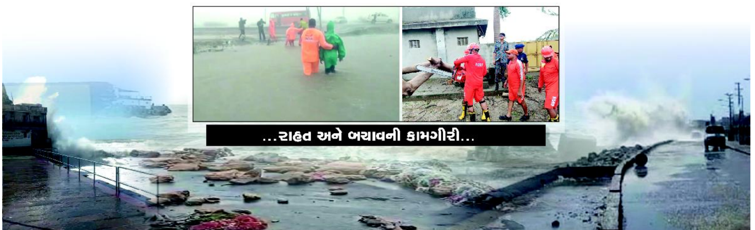
...રાહત અને બચાવની કામગીરી...