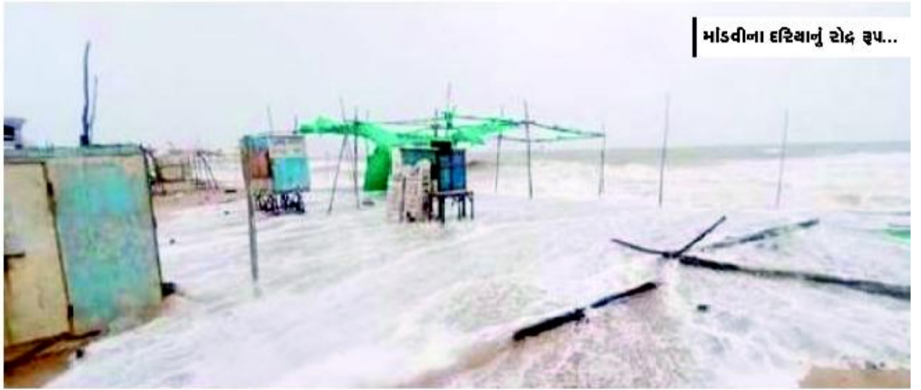
માંડવીના દરિયાનું સોદ રૂપ...