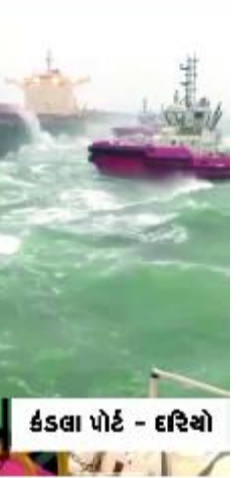
કંડલા પોર્ટ - દરિયો