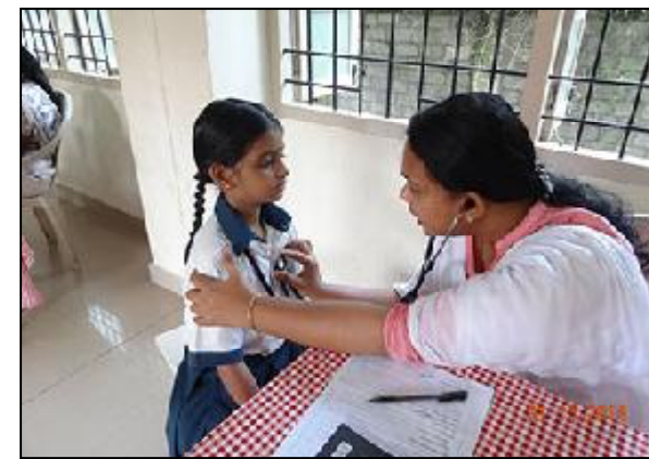
સંકલન કરશે અને આ ડિજિટલ હેલ્થ કાર્ડમાં બાળકોની આરોગ્ય માહિતીને અપડેટ કરશે. આ ડિજિટલ હેલ્થ કાર્ડ વિદ્યાર્થીઓ

નવજાતથી ૬ વર્ષ સુધીના બાળકો, પ્રાથમિક શાળાના બાળકો, માધ્યમિક/ઉચ્ચ માધ્યમિક શાળાના વિદ્યાર્થીઓ અને ૧૮ વર્ષ સુધીના શાળાએન જનાર બાળકોની પણ રાજ્ય સરકાર દ્વારા મફત આરોગ્ય તપાસ કરવામાં આવે છે. અત્રે ઉલ્લેખનીય છે કે, આ ઉલ્લેખનીય છે કે, ગુજરાત 'શાળા આરોગ્ય-રાષ્ટ્રીય બાળ સ્વાસ્થ્ય કાર્યક્રમ' (SHRBSK) અમલીકરણમાં સમગ્ર દેશમાં અગ્રણી રાજ્ય છે. આ ઝૂંબેશને સફળ બનાવવા માટે શાળા આરોગ્ય કાર્યક્રમની ૯૯૨