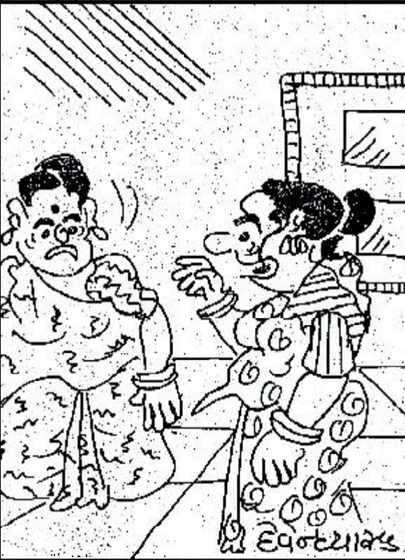
બાળકોની શાળાની ફીના કારણે મારા દાગીના અને સાડીના ખર્ચ ઉપર કાપ મુકવો પડ્યો ! બોલો ?

ઓર્ડર આપવામાં આવ્યો છે અને તેના પછી અન્ય બે ફાર્મા કંપનીને બંધ કરવામાં આવી છે. કેન્દ્રીય સ્વાસ્થ્ય મંત્રાલયના ઉચ્ચ અધિકારી સુત્રોના જણાવ્યા પ્રમાણે વિદેશોમાં ભારતીય દવાઓ પર સવાલ ઉભા થતા ડીસીજીઆઈ અને સ્ટેટ ડ્રુગ રેગ્યુલેટરે ઉત્પાદકોની ગુણવત્તાના પરિક્ષણને લઈને એક અભિયાન શરુ કરવામાં આવ્યું છે. તેના વિશે અલગ- અલગ રીતે તપાસ કરી અત્યાર સુધી ૧૩૪ દવા કંપનીઓનું ઈન્સ્પેક્શન કરવામાં આવ્યું હતું. જેમાં હિમાચલ પ્રદેશની ૧૧, ઉત્તરાખંડના ૨૨, મધ્યપ્રદેશની ૧૪, ગુજરાતની ૯, દિલ્હીની ૫, તમિલનાડુના ૪, પંજાબની ૪, હરિયાણાની ૩, રાજસ્થાનની ૨, કર્ણાટકની ૨ કંપનીઓનો સમાવેશ થાય છે. આ ઉપરાંત પશ્ચિમ બંગાળ, તેલંગાણા, પોંડુચેરી, કેરળ, જમ્મુ, સિક્કિમ, કંપની પર એસપીઓ આંધ્રપ્રદેશ, મહારાષ્ટ્ર અને ઉત્તરપ્રદેશની ૧-૧ દવા