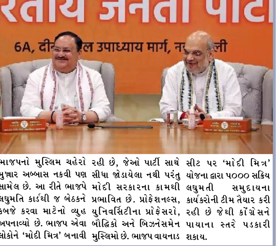
ભાજપનો મુસ્લિમ ચહેરો મુશ્તાર અબ્બાસ નકવી પણ સામેલ છે. આ રીતે ભાજપે મોદી સરકારના કામથી લઘુમતી કાર્ડથી જ બેઠકને કબજે કરવા માટેનો વ્યુહ અપનાવ્યો છે. ભાજપ એવા બોદ્ધિકો અને બિઝનેસમેન લોકોને 'મોદી મિત્ર' બનાવી મુસ્લિમો છે. ભાજપ વાયનાડ શકાય.

લઈને રાજીવ ગાંધી, સોનિયા ગાંધી અને રાહુલ ગાંધી જ્યારે પણ ચૂંટણી લડ્યા ત્યારે તેઓ જીત્યા હતા. ૨૦૦૪થી ૨૦૧૪ સુધી રાહુલ ગાંધી સતત ત્રણ વખત અમેદીથી જીતીને લોકસભામાં પહોંચ્યા, પરંતુ ૨૦૧૯માં તેમને હારનો સામનો કરવો પડ્યો. રાહુલ ગાંધીને ૨૦૧૯ની લોકસભા ચૂંટણીમાં અમેદીની સાથે વાયનાડ સીટથી પણ ચૂંટણી લડવાનો ફાયદો થયો હતો. રાહુલ વાયનાડ બેઠક પરથી જીત્યા હતા, પરંતુ હવે તેમની લોકસભાની સદસ્યતા સમાપ્ત થઈ ગઈ છે. આવી સ્થિતિમાં વાયનાડ બેઠક ખાલી પડી છે, જેના પર ભાજપની નજર છે. ભાજપની