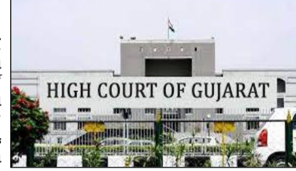
અમદાવાદ, તા. ૮ રાજ્યના સૌરાષ્ટ્રમાં આવેલા ગીર નેશનલ પાર્કમાં એશિયાટીક સિંહો અને જંગલી પશુઓ માટે નવો મેનેજમેન્ટ પ્લાન બનાવવા હાઈકોર્ટમાં જાહેર હિતની અરજી કરવામાં આવી હતી. તેની પ્રાથમિક સુનાવણી બાદ હાઈકોર્ટે રાજ્ય સરકાર અને ફોરેસ્ટ વિભાગને નોટીસો કાઢીને વધુ સુનાવણી આગામી

કાયદા મુજબ રક્ષિત જંગલો છે. પરંતુ સમયાંતરે અહિં ખૂબ જ ગીરના અભ્યારણની આસપાસ ખૂબ જ ધંધાદારી બાંધકામો થઈ ગયા છે અને પ્રવૃત્તિઓ થઈ રહી છે. ગીરના જંગલના નેશનલ પાર્ક એરિયાને અડીને રીસોર્ટ, થઈ શકતું નથી. વળી આવા હોટલ સહિતની પ્રવૃત્તિઓ થાય છે. તેના કારણે જંગલી પ્રાણીઓ માટે મુશ્કેલી થઈ રહી છે. અરજીમાં વધુમાં રજૂઆત કરાઈ હતી કે, ગીરના જંગલોમાં હાઈ ટેન્શન વાયરો પણ નાખવામાં આવ્યા છે તેના કારણે પ્રાણીઓના જીવ ઉપર જોખમ ઉભું થાય છે. આથી તેમનું રક્ષણ થવું જરૂરી છે. બીજા બાજુ ગીર મેનેજમેન્ટ પ્લાન છે તેવો જૂનો છે અને સ્થાનિક લોકોને તેના માટે વિશ્વાસમાં લેવામાં આવ્યા નથી. ગીર મેનેજમેન્ટ પ્લાન છે તે સમયજતા તેમાં પરિવર્તન જરૂરી છે. આ પ્લાન એક્સપર્ટ દ્વારા તૈયાર કરવામાં આવ્યો છે પરંતુ તેઓ આ વિસ્તારના ભૂગોળ અને સ્થાનિક સ્થિતિથી વાકેફ નહીં હોવાથી તેનું યોગ્ય અમલીકરણ થઈ શકતું નથી. આથી આવા યોગ્ય સાહિત્ય તૈયાર કરવામાં આવ્યું નથી. અરજીમાં એમ પણ અરજીમાં વધુમાં રજૂઆત કરાઈ હતી કે, ગીરનો અભ્યારણ વિસ્તાર વધ્યો છે પરંતુ લોકોની સમસ્યા અને સ્થળાંતર બાબતે કોઈ વિચાર મેનેજમેન્ટ પ્લાનમાં કરવામાં આવ્યો નથી. આ બાબતે યોગ્ય સ્ટડી કરીને વન્ય જીવો, લોકોની સમસ્યા અને પર્યાવરણની જાળવણી એમ તમામ બાબતોનો વિચાર કરીને યોગ્ય મેનેજમેન્ટ પ્લાન તૈયાર કરવો જોઈએ.