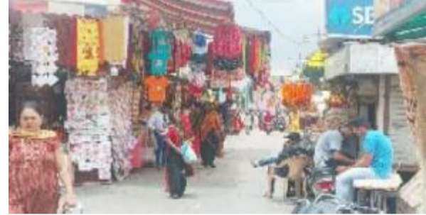
(રાકેશ સામાણી દ્વારા)

આખરે નગરપાલિકાનું તંત્ર જાગ્યું, દબાણ દૂર કરવા દસ દિવસની મુદત અપાઈ : તંત્ર ફક્ત નોટિસ આપી સંતોષ માની લે છે કે, પછી ખરા અર્થમાં કાર્યવાહી કરશે કે કેમ તેના ઉપર સૌની મિટ