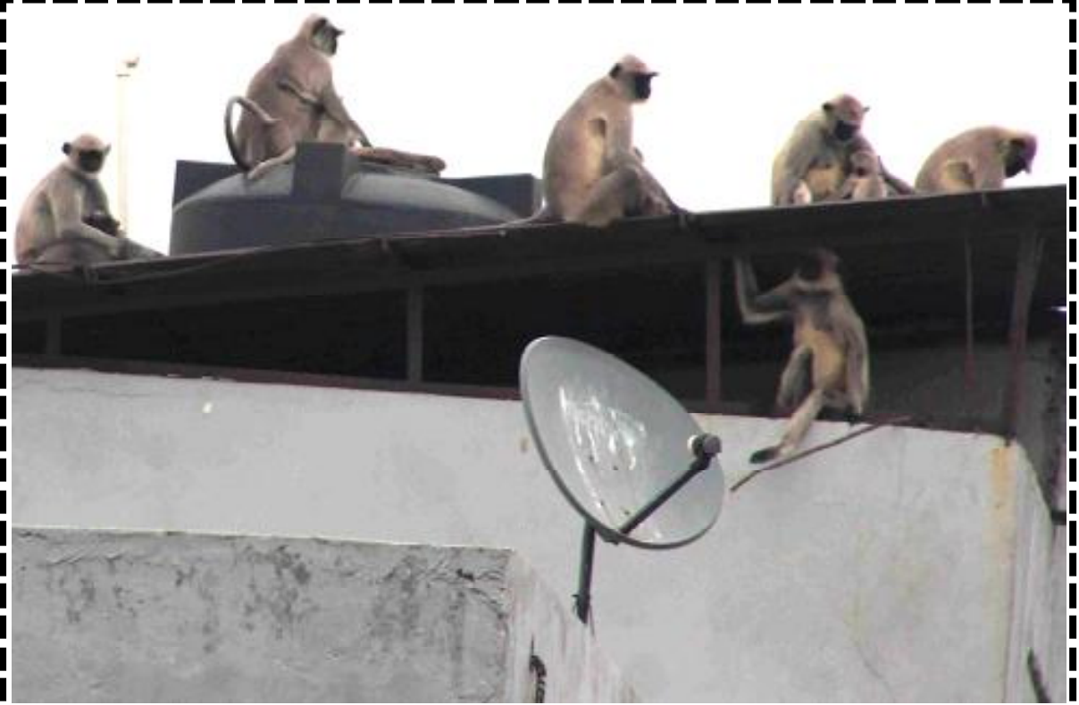
ઓફબીટ:- શિસ્ત પ્રમાણે બેઠેલ વાનર