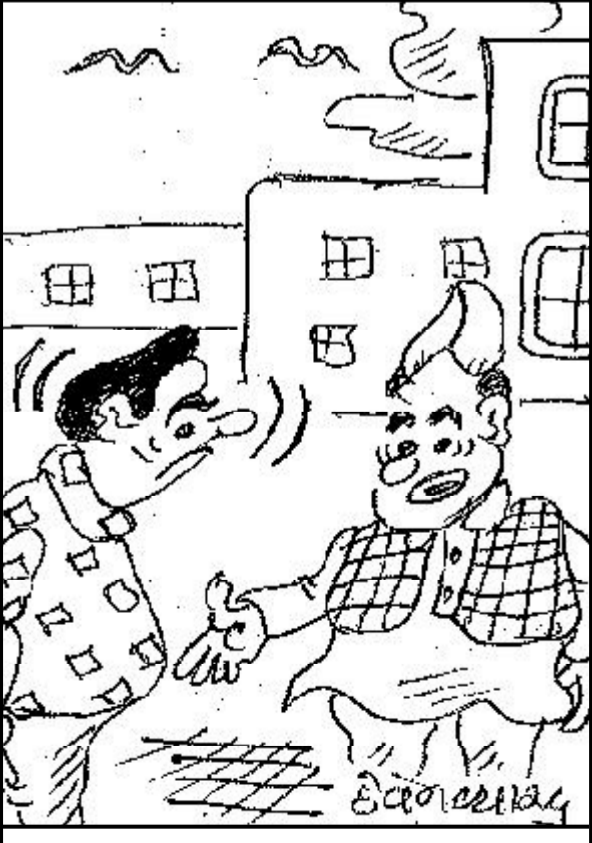
ભ્રષ્ટાચાર ન કરૂ તો તાવ આવી જાય છે!

છે, તે બધી જ વાનગીઓને ટૂંક સમયમાં જ આઈટીસી નર્મદાના પ્રશંસકો અને મહેમાનોને ઉપલબ્ધ કરાવવામાં આવશે, જેના માટે અગાઉથી ઓર્ડર આપવાનો રહેશે. 'ધી ઓરિજિન સ્ટોરી' યાર વીડિયોની શ્રેણી હશે, જેમાં રાજ્યની ભૂગોળ, લોકો અને ભોલીઓ જેટલા જ વૈવિધ્યસભર ગણાતા ગુજરાતના પાકકલાની સમૃદ્ધ સંસ્કૃતિ વિશે જાણકારી મેળવવામાં આવશે. આ સમગ્ર અનુભવને વધુ સમૃદ્ધ, અધિકૃત અને તેની મૂળભૂત પ્રકૃતિને અનુરૂપ બનાવવા માટે ગુજરાતના ઘરોમાં અવારનવાર ખવાતી આ પરંપરાગત વાનગીઓને રાંધવાની પદ્ધતિ, તેને બનાવવા માટે ઉપયોગમાં લેવાતા વાસણો અને પરંપરાગત સામગ્રીઓ વિશે ઊંડી સમજણ કેળવવા આઈટીસીની ટીમ પાકકલાના આદરપાત્ર ઈતિહાસકારો પાસેથી મૂલ્યવાન જાણકારી મેળવી રહી છે.