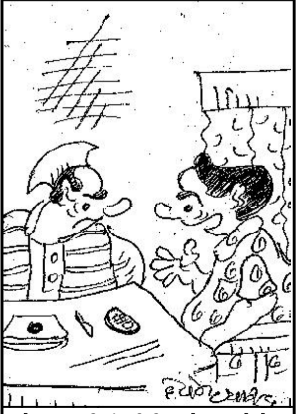
લોક સભાની ચુંટણીની વાતો થાય છે ને? બી.પી. તો રહેશે!