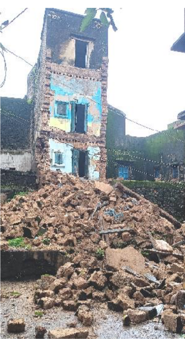
(નિલેશ રાજપરા દ્વારા)

માંગરોળ તા. ૨૧ માંગરોળમાં છેલ્લા ત્રણેક દિવસથી સતત પડી રહેલા વરસાદ અને ભેજવાળા વાતાવરણ વચ્ચે ગઈકાલે બપોરે કાપડ બજાર પાસે આવેલા ધ્રુવ ફળીયામાં એક જુનવાણી મકાનનો કેટલોક ભાગ સાંજે પત્તાની માફક ધરાશયી થયો હતો. મકાન છેલ્લા કેટલાક સમયથી બંધ હાલતમાં હતું. અહીં તદ્દન નજીકમાં આ જ સમયગાળા દરમ્યાન ટ્યુશન કલાસિંગ ચાલતા હોય, બાળકો અને વાલીઓની અવજવર રહેતી હોય, સદભાગ્યે કોઈ જાનહાની ન થતાં લોકોએ રાહતનો શ્વાસ લીધો હતો.