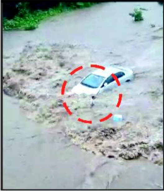
આલ્ફા સ્કુલ નજીકનાં રાયજીબાગમાં કાર તણાઈ