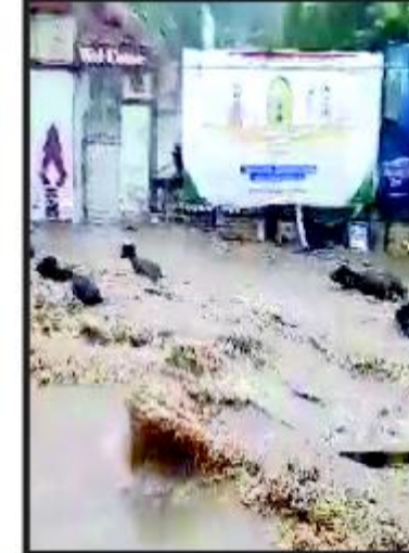
પાણીમાં પશુઓ તણાયા