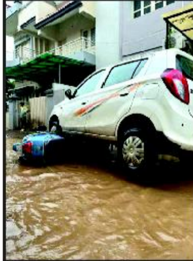
કારની નીચે સ્કુટર ફસાયું