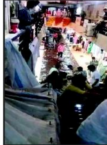
જૂનાગઢ મનપા કચેરી