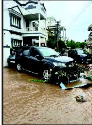
પાર્કિંગમાં તરતી કાર