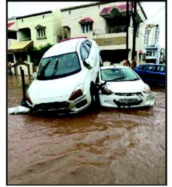
પાણીમાં તરતી કાર