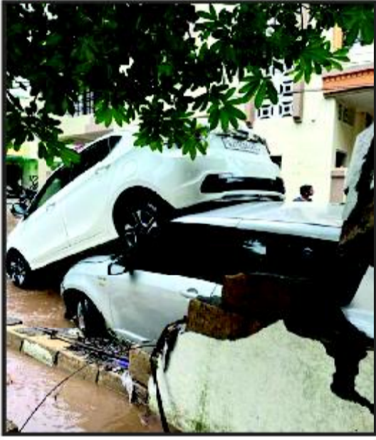
પાણીમાં તરતી કાર