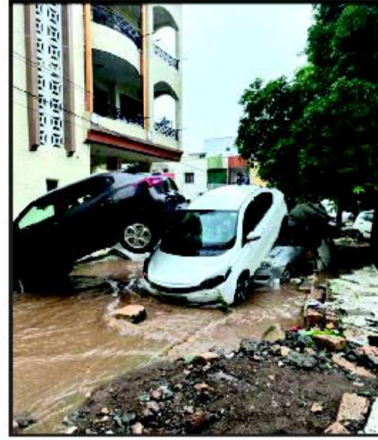
તણાયેલી કારનો ઢગલો