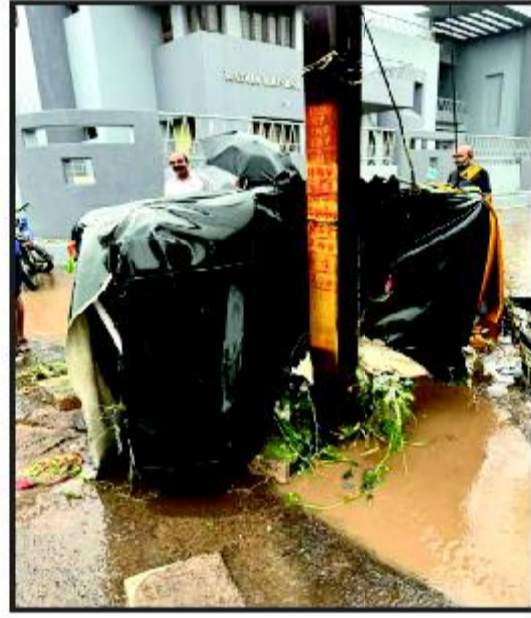
પાણીમાં તરતી કાર