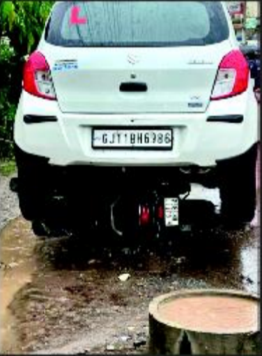
કારની નીચે બાઈક ફસાયું