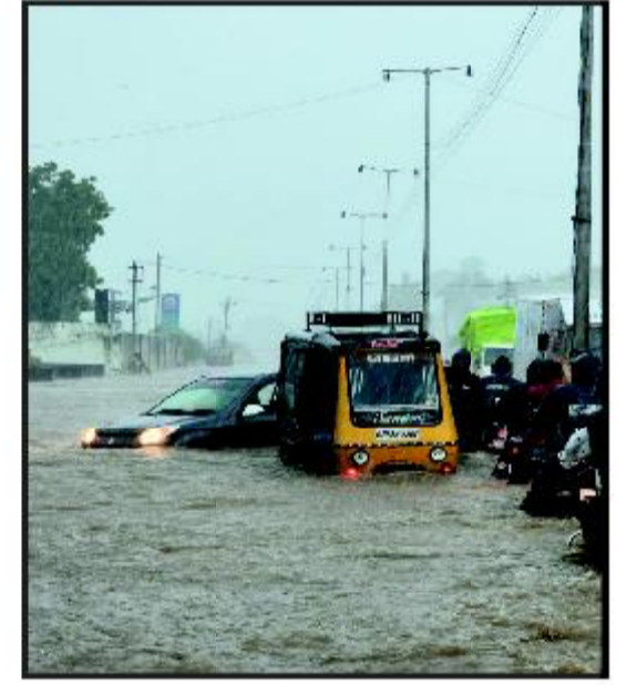
દોલતપરામાં અનેક વાહનો ફસાયા