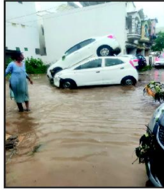
પાણીમાં તરતી કાર