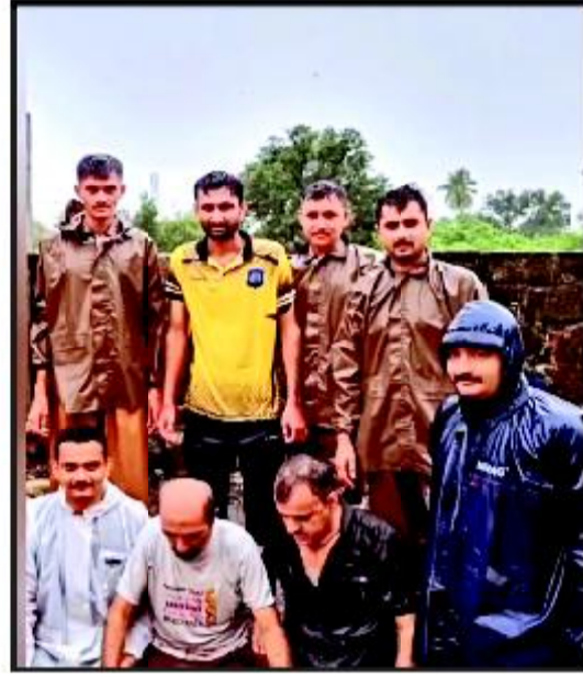
પોલીસ તેમજ સ્થાનિક મદદગારોની ટીમ