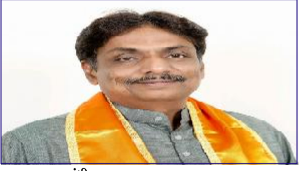
ગાંધીનગર, તા. ૧ અમદાવાદમાં આવેલી રાજસ્થાન હોસ્પિટલમાં આગની ઘટના લાગ્યા બાદ રાજ્યના

હોસ્પિટલોના બેઝમેન્ટ કે અન્ય સ્થળે પડેલી બિનજરૂરી સામાન-ભંગારના નિકાલ માટે સૂચના અપાશે