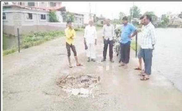
(ગોવિંદ હડિયા દ્વારા) કેશોદ તા.૫ કેશોદના મેસવાણ ગામનાં પાદરમાં બસ સ્ટેન્ડ પાસે પસાર થતાં વોકળ ઉપર તાજેતરમાં બનાવવામાં આવેલ પુલમાં પ્રથમ વરસાદમાં જ ધોવાણ થઈ જતાં કાંકરીઓ દેખાવા લાગી હતી અને હવે પાણીનું વહેણ ધીમું પડતાં પુલ ઉપર ખાડાઓ પડી જતાં કામમાં નબળી

ગુણવત્તા વાળો માલસામાન વપરી મોટાપાયે ગેરરીતિ આચરવામાં આવી હોવાનો આક્ષેપ ગ્રામજનોએ કર્યો છે. કેશોદના મેસવાણ ગામે વોકળનાં સામે કાંઠે આવેલાં પ્લોટ વિસ્તારમાં સરકારી શાળા, સરકારી દવાખાનું, પટેલ સમાજ આવેલ હોય જુનાં ગામમાંથી પ્લોટ વિસ્તારમાં આવવા જવા માં રાહદારીઓ, વિદ્યાર્થીઓ અને વાહનચાલકો હેરાનપરેશન થઈ રહ્યાં છે. કેશોદના મેસવાણ ગામે વોકળમાં પુલનું કામ ચાલુ હતું ત્યારે નબળી ગુણવત્તા વાળું કામ થયું હોવાની પદાધિકારીઓને રજૂઆત કરી હતી ત્યારે ધ્યાનમાં લેવામાં ન આવતાં સરકાર દ્વારા ફાળવવામાં આવેલ માતબર રકમ એળે ગઈ છે અને પુલ ઉપરથી પસાર થતાં રાહદારીઓ વિદ્યાર્થીઓ અને વાહનચાલકો જોખમ ખેડીને નીકળી રહ્યાં છે ત્યારે જવાબદાર પદાધિકારીઓ અને અધિકારીઓ દ્વારા તાત્કાલિક કામચલાઉ ધોરણે કામગીરી હાથ ધરવામાં આવશે નહીં તો આવનારાં દિવસોમાં ગંભીર આકસ્મિક ઘટના બને તો નવાઈ નહીં હાલ આ બાબતે ગ્રામજનોમાં ભારે રોષ જોવા મળી રહ્યો છે.