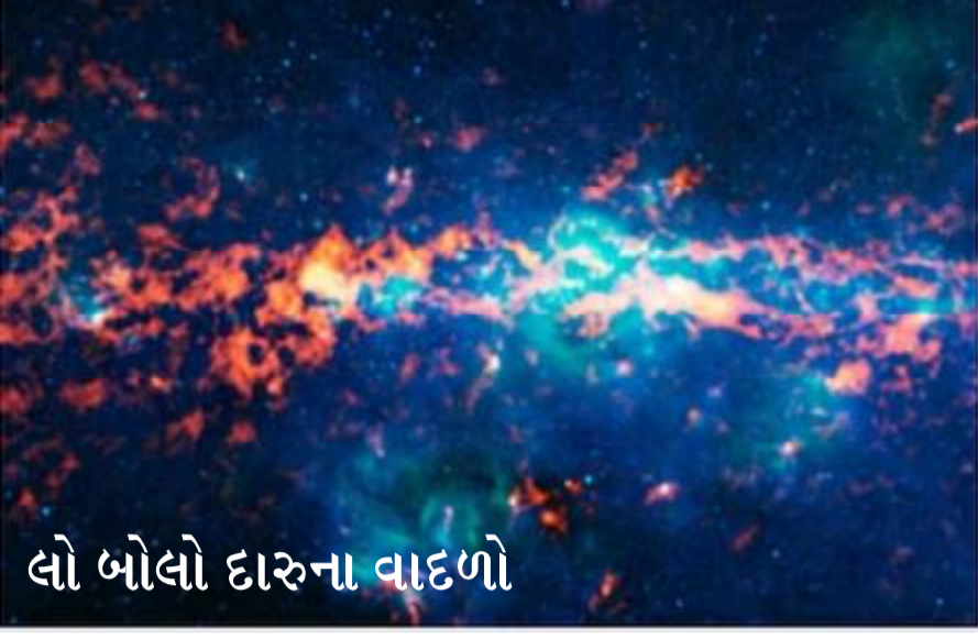
લો બોલો દારૂના વાદળો

નવી દિલ્હી, તા.૫ અવકાશમાં ઘણા બધા ગ્રહો અને તારાઓ છે. અને એ જ સમયે કેટલાક નવા સ્ટાર્સ પણ બનતા રહે છે અને જૂનાનો અંત આવતો રહે છે. હવે વૈજ્ઞાનિકોને અવકાશમાં તારાઓ અને ગ્રહોની સાથે દારૂના વાદળો પણ મળ્યા છે. જોકે, વૈજ્ઞાનિકોના મતે અવકાશમાં મળેલા આલ્કોહોલનો ભંડાર માર્શકોસ્મિક મોલેક્યુલર સ્વરૂપમાં છે. સંશોધકોના મતે, પ્રોપેનોલના રૂપમાં અંતરિક્ષમાં અત્યાર સુધીના સૌથી મોટા આલ્કોહોલ મોલેક્યુલની આ શોધ છે. સંશોધકોના મતે પ્રોપેનોલ પરમાણુ એ સ્વરૂપમાં