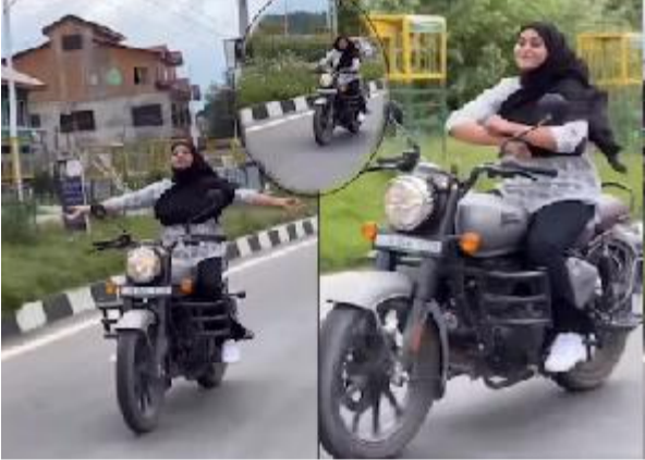
નવી દિલ્હી, તા.૮

યુવતી સ્ટંટ કરતા રોયલ એનફિલ્ડ બુલેટના હેડલ છોડીને હાથ હવામાં લહેરાવતી ગીત સાથે ડાંસના રિએક્શન આપી રહી છે