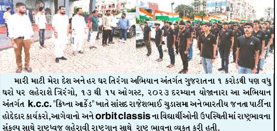
મારી માટી મેરા દેશ અને હર ઘર તિરંગા અભિયાન અંતર્ગત ગુજરાતના ૧ કરોડથી પણ વધુ ઘરો પર લહેરાશે તિરંગો, ૧૩ થી ૧૫ ઓગસ્ટ, ૨૦૨૩ દરમ્યાન યોજનાના આ અભિયાન અંતર્ગત k.c.c. "કિના આર્કેડ" ખાતે સાંસ્કૃત રાજ્યભાઈ યુવાસભા અને ભારતીય જનતા પાર્ટીના હોદ્દેદાર કાર્યકરો, આગેવાનો અને orbit classis ના વિદ્યાર્થીઓની ઉપસ્થિતિમાં રાષ્ટ્રભાવના સંકલ્પ સાથે રાષ્ટ્રધ્વજ લહેરાવી રાષ્ટ્રગાન સાથે રાષ્ટ્ર ભાવના વ્યક્ત કરી હતી.

ZED ( ZERO EFFECET, ZERO DEFECT) સર્ટિફિકેટ મેળવવા માટે ઓનલાઈન રજીસ્ટ્રેશન કરાવવાનું રહેશે