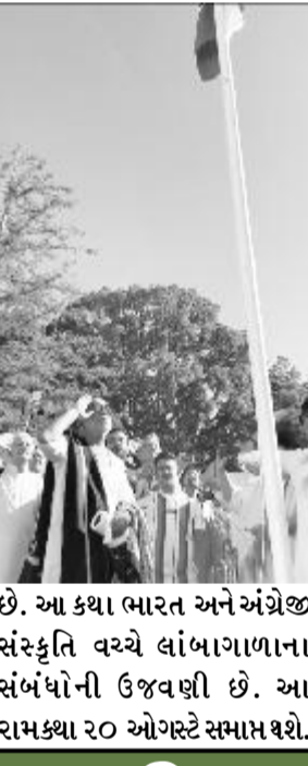
પૂજ્ય મોરારી બાપુએ સ્વતંત્રતા દિવસની ઉજવણીમાં શિક્ષકો, ખેડૂતો અને માછીમારોને મહેમાન તરીકે આમંત્રિત કરવાના મોટી સરકારની પહેલની પ્રશંસા કરી

(પ્રતિનિધિ દ્વારા) કેમ્પિજ તા.૧૮ પ્રસિદ્ધ કથાકાર પૂજ્ય મોરારી બાપૂએ નવી દિલ્હીમાં સ્વતંત્રતા દિવસની ઉજવણી પ્રસંગે શિક્ષકો, માછીમારો અને ખેડૂતોને આમંત્રિત કરવા બદલ પ્રધાનમંત્રી નરેન્દ્ર મોદીના નેતૃત્વ હેઠળની કેન્દ્ર સરકારની પ્રશંસા કરી હતી. પૂજ્ય બાપૂએ કેમ્પિજ યુનિવર્સિટી ખાતેથી તમામ ભારતીયોને સ્વતંત્રતા દિવસની શુભેચ્છા પાઠવતાં કહ્યું હતું કે, માછીમારો, શિક્ષકો અને ખેડૂતોને સ્વતંત્રતા દિવસની ઉજવણી માટે આમંત્રિત કરવા ખુબજ સારી પહેલ છે. કદાચ પહેલીવાર મોટી સંખ્યામાં સામાન્ય વ્યક્તિઓને ખેડૂતો, ૫૦ પ્રાથમિક શાળાના શિક્ષકો, નર્સ અને માછીમારોને આમંત્રિત કરવામાં આવ્યાં છે. ઉલ્લેખનીય છે કે પ્રધાનમંત્રી નરેન્દ્ર મોદીના નેતૃત્વ હેઠળ લાલ કિલ્લાથી સમગ્ર દેશ આ ઉપરાંત વિશિષ્ટ મહેમાનોની યાદીમાં ૫૦ બાંધકામ કામદારો પણ સામેલ હતાં કે જેઓ નવી સંસદના નિર્માણમાં સામેલ હતાં તથા ૫૦ કામદારો વિશાળ માર્ગો અને બીજા પ્રોજેક્ટ્સના નિર્માણમાં સામેલ હતાં. ૭૫ દંપતિઓ પારંપરિક વસ્ત્રોમાં ઉપસ્થિત રહ્યાં હતાં. પૂજ્ય બાપુની રામકથા હાલ યુનિવર્સિટી ઓફ કેમ્પિજની જિસસ કોલેજ ખાતે ચાલી રહી છે. આ કથા ભારત અને અંગ્રેજી સંસ્કૃતિ વચ્ચે લાંબાગાળાના સંબંધોની ઉજવણી છે. આ રામકથા ૨૦ ઓગસ્ટે સમાપ્ત થશે.