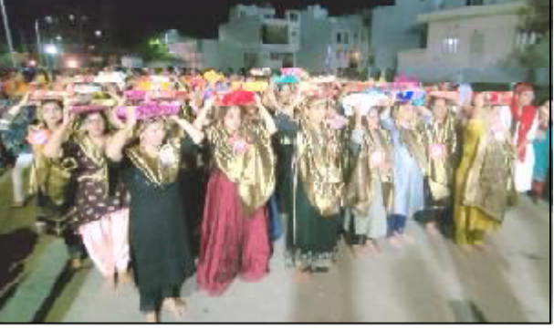
તાલ સાથે નગરકીર્તન વેરાવળનાં ગુરૂનાંક ચોક ખાતેથી નીકળી, શ્રીપાલ ચોક, હવેલી ચોક, બિહારીનગર, કરમચંદબાપા ચોક થઈને વિદ્યાશાહબાગ ખાતે પૂર્ણાહુતિ પહોંચી હતી. જ્યાં સૌપ્રથમ આરતી સ્પર્ધા, જૂનાગઢની મંડળી દ્વારા સત્સંગ તેમજ સમુદલંગરપ્રસાદ જેવા ધાર્મિક કાર્યક્રમોનું ભવ્ય આયોજન ગુરૂનાંક કીર્તન મંડળી દ્વારા કરવામાં આવ્યું હતું. ગુરૂ ગ્રંથ સાહિબની ભવ્ય શોભાયાત્રા રાજમાર્ગ ઉપર નીકળી ત્યારે જુદા જુદા સમુદાય દ્વારા સ્વાગત અભિવાદન કરાયું હતું. શોભાયાત્રામાં મોટી સંખ્યામાં ભાઈઓ-બહેનો આસ્થાભરે જોડાયા હતા.