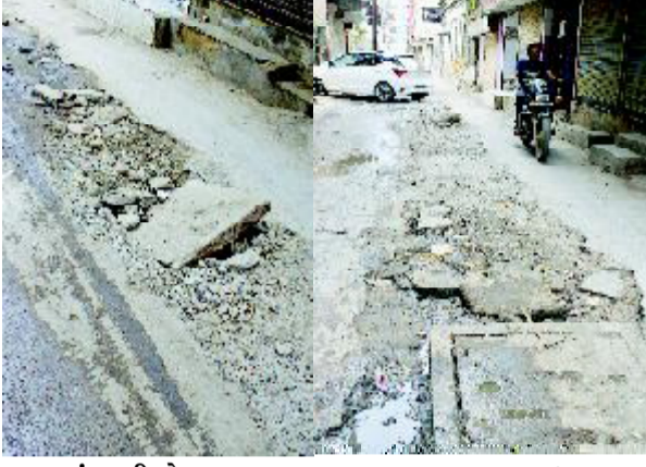
કરવામાં આવી છે. જૂનાગઢ શહેરના ટ્રાફિકથી

(પ્રતિનિધિ દ્વારા) જૂનાગઢ તા. ૧૯ જૂનાગઢ શહેરને જાણે કોઈના પાપે અને સત્તાધિશોની અપઆવડતના પરિણામે જાણે કોઈએ શ્રાપ આપ્યો હોય તેમ આ શહેરના વિવિધ રસ્તાઓ, સોસાયટી, મોહલાઓની હાલત ક્યારે પણ સુધરી નથી. આજે સૌરાષ્ટ્ર ભૂમિ અખબારને શહેરના રસ્તાઓની કેવી હાલત છે તે અંગેની કેટલીક તસ્વીરો પ્રાપ્ત થઈ છે જે અત્રે પ્રસ્તુત