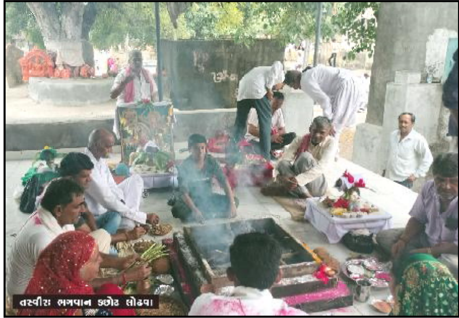
તસ્વીર : ભગવાન કોઈ લોઢવા (ભોળા જાદવ દ્વારા) હડકાયા કુતરાની મોટી રજાડ લોઢવા તા. ૧૯ હતી તેથી ગામલોકોએ વાછડા લોઢવા ગામમાં અજ્ઞાતી ૧૬ દાદાના ભુવા પાસે આ અંગે વર્ષ પહેલાં જેરી સાપ તથા પુણવતા ભુવાઆતાએ કહેલ કે

૩૦ મણ લોટની પુરી, ૩૦૦૦ લીટર દુધનો દુધપાક તથા ૧૦ ગુણી બટકાની સુકી ભાજી બનાવવામાં આવી