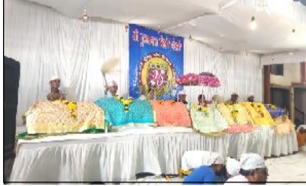
(મીનાક્ષી ભાસ્કર વૈદ્યદ્વારા) જીવિત ગુરૂનો દરજ્જો પ્રાપ્ત પ્રભાસ પાટણ, તા. ૧૯ એવા ગુરૂ ગ્રંથ સાહિબના પ્રકાશ ઉત્સવનાં આયોજનમાં વેરાવળ વેરાવળમાં સ્થિત સચખંડ ગુરૂ દરબારમાં સમગ્ર વર્ષ દરમિયાન શીખ સમુદાયના ૧૧ ગુરૂ દેવનાં તમામ ગુરૂ પ્રભાસ ધામધૂમથી ઉજવાય છે પરંતુ આ વર્ષે ભારતના સુપ્રીમ કોર્ટ દ્વારા