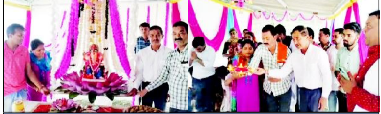
અનસુયા ગૌધામ ખાતે ચાલુ વરસાદે વિઘ્નહર્તાને પધારાવ્યા તથા સાંજે સત્યનારાયણ કથા, સુંદર કાંડના પાઠ તથા ભજન કિર્તન સાથે જમાવટ

(ગીરીશ પટેલ દ્વારા) માણાવદર તા.૨૦ માણાવદર શહેરમાં બે દિવસથી મેઘરાજાની મહેરબાની થઈ છે તેના વચ્ચે ગણેશોત્સવના મોટા મહોત્સવ સમા કાર્યક્રમોની ધમાકેદાર શરૂઆત શહેરજનોએ ગણેશજીની નાનાથી વિશાળ