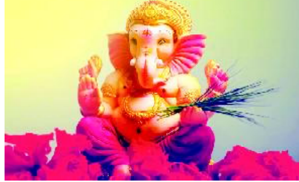
અમદાવાદ, તા. ૨૦

રિલાયન્સ જિયોએ આજે ૧૯મી સપ્ટેમ્બરે ગણેશ ચતુર્થીના દિવસે તેની એર ફાઈબર સેવા શરૂ કરી છે. હાલમાં આ સેવા અમદાવાદ, બેંગલુરુ, ચેન્નાઈ, દિલ્હી, હૈદરાબાદ, કોલકાતા, મુંબઈ અને પુણે - ૮ શહેરોમાં ઉપલબ્ધ રહેશે. એર ફાઈબર માટે ૧૦૦૦ રૂપિયા ઈન્સ્ટોલેશન ચાર્જ ચૂકવવો પડશે. તમે તેને ૧૦૦ રૂપિયામાં ભુક્ત કરાવી શકો છો. આ રકમ બિલમાં એડજસ્ટ કરવામાં આવશે. એર ફાઈબર ભુક્ત કરવા માટે તમારે Jio ની ઓફિશિયલ વેબસાઈટ