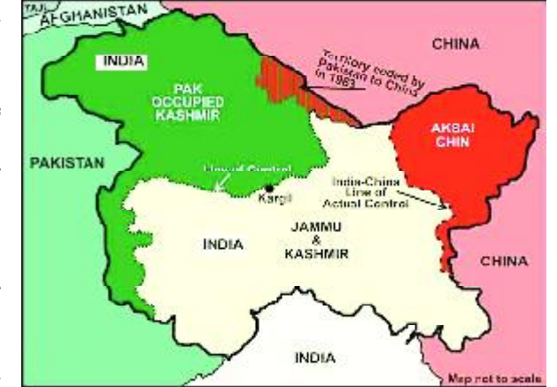
તોડી નાખો. બીજું, તેના ગેરકાયદે અને બળજબરીપૂર્વકના કબજા હેઠળના ભારતીય વિસ્તારને ખાલી કરો. ત્રીજું, પાકિસ્તાન દ્વારા લઘુમતીઓ સામે ગંભીર અને સતત માનવ અધિકારોના ઉલ્લંઘનને રોકવામાં આવે પાકિસ્તાનને કાશ્મીર પર બોલવાનો કોઈ અધિકાર નથી.

ખાલી કરવા જણાવ્યું હતું. ભારતે કહ્યું કે કેન્દ્રશાસિત પ્રદેશના કબજા હેઠળના વિસ્તારને ખાલી કરવાની સાથે આતંકવાદ વિરુદ્ધ કાર્યવાહી કરવી જોઈએ. તેમણે ૨૬/૧૧ના આતંકવાદી હુમલાના આરોપીઓને સજા આપવાની અપીલ કરી હતી. અગાઉ પાકિસ્તાને ભારત સામે ઝેર ઓક્યું હતું. તેના પર ભારતે કહ્યું કે પાકિસ્તાન યુએન પ્લેટફોર્મનો દુરુપયોગ કરે છે.