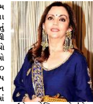
ફાઉન્ડેશન હોસ્પિટલ અને સંશોધન કેન્દ્ર દ્વારા તમામ ભારતીયોને નજીવા પર્યે વિશ્વ-સરની તબીબી સારવાર ઉપલબ્ધ કરાવી રહ્યા છે. નીતા અંબાણીના નેતૃત્વ હેઠળ, રિલાયન્સ ફાઉન્ડેશન તમામ લોકો માટે એકંદરે સુખાકારી અને ઉચ્ચ ગુણવત્તાયુક્ત જીવનશૈલી સુનિશ્ચિત કરવા પરિવર્તનકારી ફેરફારોની સુવિધા આપવા માટે કામ કરી રહ્યાં છે.

સુશોભિત એક ભવ્ય કમળ-શીમ આધારિત ઝુમ્મર પણ છે. આ સિવાય અહીં ૨૦૦૦ બેઠકો ધરાવતું ભવ્ય થિયેટર છે, જેમાં દેશનો સૌથી મોટું ઓર્ગેસ્ટ્રા પિનાવવામાં આવ્યો છે. નાના પ્રદર્શનો અને કાર્યક્રમો માટે, 'સ્ટુડિયો થિયેટર'માં ૨૫૦ બેઠકો હશે, અને 'ધ ક્યુબ'માં ૧૨૫ બેઠકો હશે. આ બધામાં અદ્યતન ટેકનોલોજીનો ઉપયોગ કરવામાં આવ્યો છે. રિલાયન્સ ફાઉન્ડેશનની વેબસાઈટ અનુસાર, તેઓ ઈન્ટરનેશનલ ઓલિમ્પિક કમિટીના સભ્ય તરીકે ચૂંટાયેલા પ્રથમ ભારતીય મહિલા છે અને મેટ્રોપોલિટન મ્યુઝિયમ ઓફ આર્ટ, ન્યૂ યોર્કના બોર્ડના માનદ ટ્રસ્ટી તરીકે ચૂંટાયેલા પ્રથમ ભારતીય છે. નીતા અંબાણી મુંબઈમાં સર એચએન રિલાયન્સ આપવા માટે કામ કરી રહ્યાં છે.