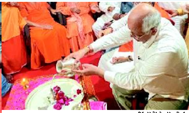
જૂનાગઢ તા. ૨૮ ઈતિહાસનો ભવ્ય વારસો, અનેક સદીઓની ઓળખ અને સોરઠની શાન સમાન ઉપરકોટનો ભવ્ય કિલ્લો આખરે આજથી જાહેર જનતા માટે ખુલ્લો મુકાયો છે. મુખ્યમંત્રી ભૂપેન્દ્રભાઈ પટેલનાં હસ્તે ઉપરકોટનાં કિલ્લાને ખુલ્લો મુકવામાં આવ્યો છે.

આજથી ઉપરકોટનો કિલ્લો જૂનાગઢવાસીઓ અને જૂનાગઢની મુલાકાતે આવતા પ્રવાસીઓ માટે એક નવવું નજરાણું અને યાદગાર પુસ્તક બનશે. આજથી ચાર દિવસ સુધી તમામ નાગરીકો માટે ઉપરકોટનાં કિલ્લામાં ફ્રી એન્ટ્રી રાખવામાં આવી છે. તા. ૨૮ સપ્ટેમ્બરથી તા. ૨ ઓક્ટોબર દરમિયાન તમામ નાગરીકો ઉપરકોટમાં વિનામૂલ્યે પ્રવેશ કરી શકશે. તા. ૩ ઓક્ટોબર મંગળવારથી નિશ્ચીત ટીકીટ સાથે પ્રવેશ મળશે તેવું સુત્રોમાંથી જાણવા મળી રહ્યું છે. ઉપરકોટનું લોકાર્પણ કર્યા બાદ મુખ્યમંત્રીએ જૂનાગઢનો મીની તાજમહેલ ગણાતા મહાબત મકબરાનું પણ લોકાર્પણ કર્યું હતું. મહાબત મકબરા અને બહાઉદીન મકબરા પ્રી-વેડીંગ અને પોસ્ટ વેડીંગ ફોટોગ્રાફીનાં ડેસ્ટીનેશન તરીકે અગાઉ પણ ભારે લોકપ્રિય હતા ત્યારે