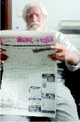
(પ્રકાશ ભાદરકા દ્વારા)

જૂનાગઢ તા. ૨૮ જૂનાગઢ શહેર એટલે સેવાકીય કામગીરીનું મુખ્ય કેન્દ્ર ગણાય છે. આ શહેરમાં અનેક સેવાભાવી સંસ્થાઓ અને સેવાભાવી યુવકો જ્યાં મદદ માટેનો પોકાર પડે ત્યાં ધીના છાત્રા ભાગમાં પહોંચી જાય છે. આ સેવા યજ્ઞ ચલાવનારા અનેક સંસ્થાઓ પૈકી જૂનાગઢના એક સેવાકર્મી કે જે વૃક્ષવત્ના આરે પહોંચ્યા છે પરંતુ એકલવીરની