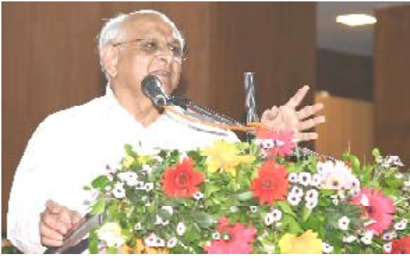
(પ્રતિનિધિ દ્વારા) જૂનાગઢ તા.૨૯ ગુજરાતના મુખ્યમંત્રી ભૂપેન્દ્રભાઈ પટેલ ગઈકાલે જૂનાગઢના મોઢેરા મહેમાન બન્યા હતા અને તેઓની ઉપસ્થિતિમાં ઉપરકોટ તેમજ મકબરાનું લોકાર્પણ તેમજ વિવિધ વિકાસના કામોને પણ નવી દિશા મળી હતી અને આ લોકાર્પણનો એક શાનદાર સમારોહ શામળદાસ ગાંધી ટાઉન હોલ ખાતે યોજાયો હતો. જેમાં પ્રાસંગિક ઉદ્બોધનમાં

દિવાળી પહેલા રસ્તા ઉત્તમ બની જાય તે માટે મેયર, ડે. મેયર સહિતનાં પદાધિકારીઓએ ધ્યાન આપવું પડશે