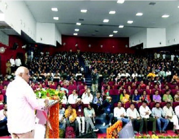
જૂનાગઢ, તા.૨૯ જૂનાગઢના પ્રવાસે આવેલા મુખ્યમંત્રી ભૂપેન્દ્રભાઈ પટેલે તબક્કાવાર આયોજિત વિકાસના કામોમાં હાજર રહેલા ભાજપના એક પણ નેતાના વખાણ તો ઠીક પરંતુ તેમના કામથી નારાજ હોવાનું

એક પણ નેતાના વખાણ તો ઠીક પરંતુ તેમના કામથી નારાજ હોવાનું સ્પષ્ટ નજરે ચઢ્યું હતું