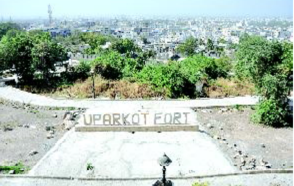
(પ્રતિનિધિ દ્વારા) જૂનાગઢનું અમૂલ્ય નજરાણું જૂનાગઢ તા.૨૯ બની ગયેલા ઐતિહાસિક

આજે સવારના ૯ વાગ્યા સુધીમાં ૪૦૦થી વધુ લોકો એ ઉપરકોટના કિલ્લાનો આનંદ માણ્યો