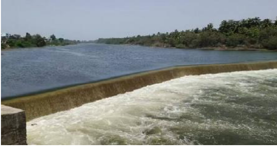
ગીર સોમનાથ, તા. ૨૯ શિંગોડા ડેમ જામવાળા સ્થિત ગીર સોમનાથનો આ જંગલ વિસ્તારમાં આવેલો છે.