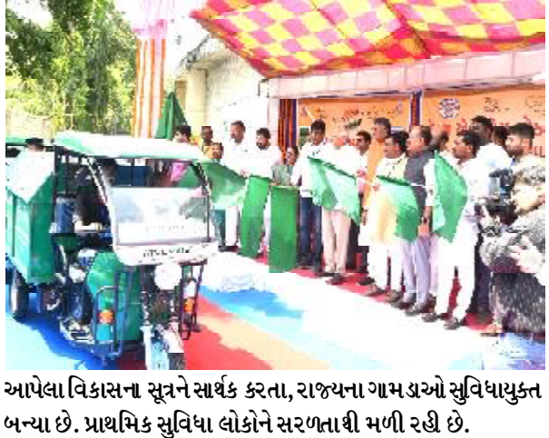
આપેલા વિકાસના સૂત્રને સાર્થક કરતા, રાજ્યના ગામડાં સુવિધાયુક્ત બન્યા છે. પ્રાથમિક સુવિધા લોકોને સરળતાથી મળી રહી છે.