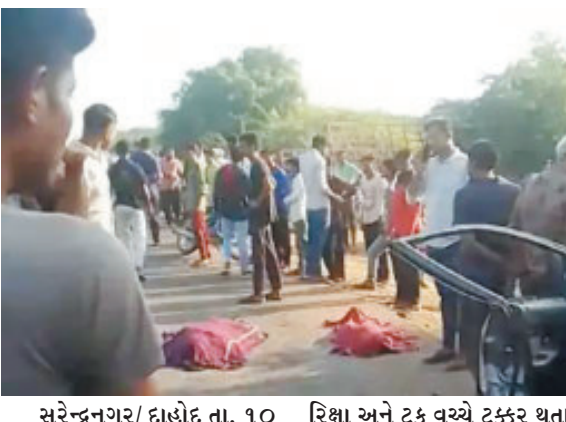
સુરેન્દ્રનગર/દાહોદ તા. ૧૦ : રાજ્યમાં આજે અકસ્માતની ત્રણ ઘટના સામે આવી છે, જેમાં ૧૧ લોકોનાં મોત થયાં છે. દાહોદમાં

જ્યારે જામનગરમાં બેકાર વચ્ચે ટક્કર થતાં પતિ-પત્નીનું મોત નિપજાયું છે. દાહોદમાં ગરબા તાલુકામાં રહેતો પરિવાર રાજકોટ મુકામે રોજી રોટી અર્થે ગયો હતો. જે બાદ આજે સવારે વતનમાં પરત ફર્યા હતા.