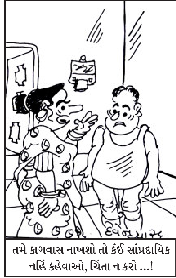
તમે કાગવાસ નાખશો તો કંઈ સાંપ્રદાયિક નહિં કહેવાઓ, ચિંતા ન કરો ...!