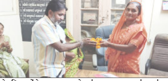
એક દિવસ કોંગ્રેસના ગઢ ગણાતો હતો પરંતુ આ વખતે કોંગ્રેસનો ગઢ તોડીને ભાજપે પોતાની બહુમતી હાસલ કરવામાં સફળ રહી હતી અને પાંચવર્ષ તાલુકા