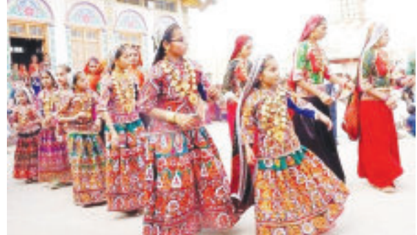
તડામાર તૈયારીઓમાં લાગી ગયા હતા. ૨૨ ગરબાની રમઝટ માટે વિશાળ ગાઉન્ડ તૈયાર કરાયું છે. તો સુચારૂ બેઠક વ્યવસ્થા પણ કરવામાં આવી છે. રોશનીના ઝગમગાટ વચ્ચે નામાંકિત કલાકારો અને ઓરકેસ્ટ્રાની સંગાથે રાસ રસીકો જૂમી ઊઠશે. ત્યારે આહીર સમાજના ભવ્ય નવરાત્રી મહોત્સવ રાસોત્સવ ૨૦૨૩માં વેરાવળ શહેર અને ગ્રામ્ય વિસ્તારમાં વસતા આહીર સમાજના પરિવારોને ઉલ્લાસભર જોડાવા આહીર સમાજ દ્વારા ભાવભર્યું આમંત્રણ પાઠવવામાં આવ્યું છે.

(રાકેશ પરડવા દ્વારા) વેરાવળ ખાતે આહીર સમાજ દ્વારા ભવ્ય નવરાત્રી મહોત્સવનું આયોજન કરવામાં આવ્યું છે. વેરાવળ પાટણ શહેર અને તાલુકાના ગ્રામ્ય વિસ્તારોમાં વસતા આહીર સમાજના પરિવારો માટે વેરાવળ બાયપાસ ઉપર આહીર સમાજની વાડીના વિશાળ ગ્રાઉન્ડ ઉપર તા. ૧૫ થી ૨૩ સુધી નવરાત્રી રાસોત્સવ યોજાશે. આહીર સમાજના ભવ્ય રાસોત્સવમાં પરંપરાગત પહેરવેશ સાથે સમુદાયના ભાઈઓ-બહેનો માં આઘશક્તિની આરાધનામાં લીન બનશે. આહીર સમાજ નવરાત્રી સમિતિના યુવાનો દ્વારા છેલ્લા દોઢેક માસથી રાસોત્સવની તડામાર તૈયારીઓમાં લાગી ગયા હતા. ૨૨ ગરબાની રમઝટ માટે વિશાળ ગાઉન્ડ તૈયાર કરાયું છે. તો સુચારૂ બેઠક વ્યવસ્થા પણ કરવામાં આવી છે. રોશનીના ઝગમગાટ વચ્ચે નામાંકિત કલાકારો અને ઓરકેસ્ટ્રાની સંગાથે રાસ રસીકો જૂમી ઊઠશે. ત્યારે આહીર સમાજના ભવ્ય નવરાત્રી મહોત્સવ રાસોત્સવ ૨૦૨૩માં વેરાવળ શહેર અને ગ્રામ્ય વિસ્તારમાં વસતા આહીર સમાજના પરિવારોને ઉલ્લાસભર જોડાવા આહીર સમાજ દ્વારા ભાવભર્યું આમંત્રણ પાઠવવામાં આવ્યું છે.