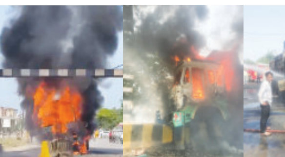
(પ્રતિનિધિ દ્વારા) પાસે ગઈકાલે બપોરના સમયે જૂનાગઢ તા. ૧૮ જી જે - ૧૦-ટીટી-૯૦ ૧૪ જૂનાગઢના યોબારી ફાટક નંબરનું ડમ્પર પસાર થઈ રહ્યું

હતું. આ દરમ્યાન સામેથી આવતી કારને બચાવવા જતા ડમ્પર ચાલકે કાબુ ગુમાવ્યો હતો અને આ ડમ્પર ડિવાઈડર સાથે ધડાકાભેર અથડાયું હતું અને બાદમાં ડિઝલની ટાંકી તુટી જતા સ્પાઈક થતા ડમ્પર આગની લપેટમાં આંતું ગયું હતું. આ દરમ્યાન જૂનાગઢ ફાયર વિભાગને જાણ કરવામાં આવતા ફાયર વિભાગની ટીમ ઘટના સ્થળે પહોંચી હતી અને આગને કાબુમાં લીધી હતી.