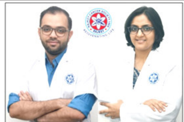
સારવારથી આ કેન્સરને ધટવાથી દર્દીને ખુબ સારી સંપૂર્ણપણે મટાડી શકાય છે "જીવનની ગુણવત્તા" પ્રદાન તેમજ સારવાર થકી આડઅસરો કરી શકાય છે.

(પંકજ ઝીબા દ્વારા) રાજકોટ, તા.૧૮ સ્તન કેન્સર એ ભારતીય મહિલાઓમાં સૌથી વધુ જોવા મળતું કેન્સર છે. જેના આંકડા પ્રતિદિન વધી રહ્યા છે. ભારતમાં દર ૪ મિનિટે એક સ્ત્રીમાં સ્તન કેન્સરનું નિદાન થાય છે. જ્યારે દર ૧૩ મિનિટે એક સ્ત્રી સ્તન કેન્સરથી મૃત્યુ પામે છે, જે અત્યંત ચિંતાજનક વિષય છે. આથી જ ઓક્ટોબર મહિનાને વિશ્વસ્તરે "સ્તન કેન્સર જાગૃતિ માસ" તરીકે ઉજવવામાં આવે છે, જેથી આ કેન્સર માટે જવાબદાર પરિબળો વિશે જન જાગૃતી કેળવીને તેને થતું અટકાવી શકાય તેમજ શરૂઆતના સ્ટેજમાં નિદાન ની " ૨ કી ની ગ " પદ્ધતિઓના બહોળા પ્રચારથી તેને વહેલી સારવાર આપી દર્દીને જળમુળમાંથી કેન્સરમુક્ત કરી શકાય છે. સ્તન કેન્સર સામાન્ય રીતે ૫૦-૬૦ વર્ષની સ્ત્રીઓમાં જોવા મળે છે. પરંતુ તે નાની વયની સ્ત્રીઓમાં તેમજ પુરુષોમાં પણ થઈ શકે છે. આ માટે જવાબદાર કારણોમાં મુખ્યત્વે મોટી ઉંમરે માતૃત્વ, બાળકોને સ્તનપાન ના કરાવવું, મેદસ્વિતા, અમુક અંતઃસ્ત્રાવી દવાઓનો ઉપયોગ, ધુમ્રપાન કે દારૂનું સેવન તેમજ આનુવંશિક પરિબળોનો સમાવેશ થાય છે. સ્તન કેન્સરની સ્કીનીંગ