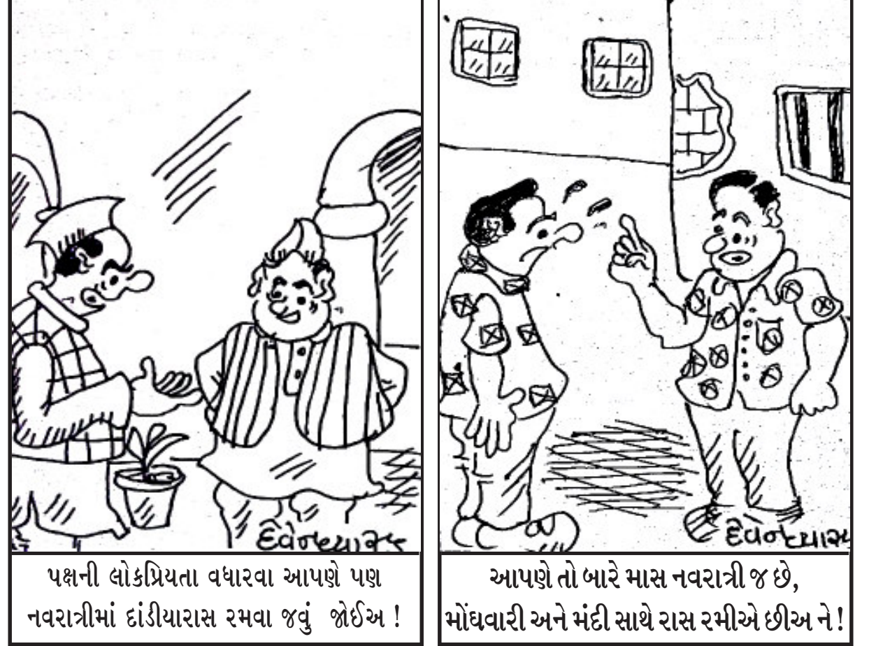
પક્ષની લોકપ્રિયતા વધારવા આપણે પણ નવરાત્રીમાં દાંડીયારાસ રમવા જવું જોઈએ !

જૂનાગઢ, તા.૧૯ સ્વચ્છતા હી સેવા અભિયાન વેગવાન બન્યું છે, પદાધિકારી- અધિકારીની સાથે લોકો પણ આ સ્વચ્છતા અભિયાનમાં જોડાઈ રહ્યા છે. સાથો સાથ લોકોમાં સ્વચ્છતા જાળવવા માટે જાગૃતિ પણ ઊભી થઈ રહી છે. આ કડીમાં ચોરવાડ નગરપાલિકા દ્વારા સ્વચ્છતા હી સેવાની નેમ સાથે પર્યટન સ્થળ એવા હોલીડે કેમ્પ બીચ ખાતે સફાઈ અભિયાન હાથ ધરવામાં આવ્યું હતું. જેમાં ચીફ ઓફિસરના માર્ગદર્શન હેઠળ સેનિટેશન શાખાના કર્મચારીઓ દ્વારા ચોરવાડના વોર્ડ નં. ૫ માં આવેલ આ હોલીડે કેમ્પ બીચ ખાતે સફાઈ કરવામાં આવી હતી. જેમાં અંદાજે ૧.૮ જેટલ કચરો એકત્રિત કરવામાં આવ્યો હતો.