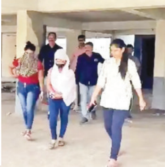
જૂનાગઢ તા. ૧૯

જૂનાગઢ શહેરમાં દેહ વ્યાપાર તેમજ કુટણખાનું ચાલતું હોવાની ચોક્કસ ખાતમીના આધારે