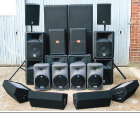
(પ્રતિનિધિ દ્વારા) જૂનાગઢ તા. ૧૯