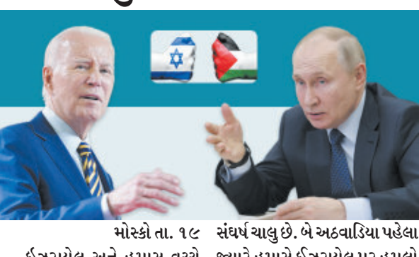
મોસ્કો તા. ૧૯ : ઈઝરાયેલ અને હમાસ વચ્ચે સંઘર્ષ ચાલુ છે. બે અલ્ટ્રાસોનિક મિસાઈલો જ્યારે હમાસે ઈઝરાયેલ પર હુમલો કર્યો ત્યારે અમેરિકા તુરંત જ ઈઝરાયેલના સમર્થનમાં આવ્યું. રાષ્ટ્રપતિ જો બાયડેનને તમામ સહાયતાની પાતરી આપી અને થોડા કલાકોમાં ઈઝરાયેલ તરફ લશ્કરી કાફલો મોકલ્યો. એમ કહી શકાય કે અમેરિકા ઈઝરાયેલને પેલેસ્ટાઈન સંઘર્ષમાં વધારે રસ દાખવી રહ્યું છે, પરંતુ તેનાથી રશિયન પ્રમુખ વ્લાદિમીર પુટિન કરવાનો આદેશ આપ્યો છે.

પણ નારાજ થયા છે. જોકે તેમની ચિંતાનું કારણ શું છે? દરમિયાન રશિયાના રાષ્ટ્રપતિએ ઈઝરાયેલને અમેરિકાની મદદ અંગે ચીનમાં રાષ્ટ્રપતિ શી જિનપિંગ સાથે મુલાકાત કર્યા બાદ પત્રકાર પરિષદમાં પોતાના વિચારો વ્યક્ત કર્યા હતા. રશિયન રાષ્ટ્રપતિએ કહ્યું કે અમેરિકાએ ઈઝરાયેલ અને પેલેસ્ટાઈન વચ્ચેના સંઘર્ષના જવાબમાં ભૂમધ્ય સમુદ્રમાં બે એરક્રાફ્ટ કેરિયર મોકલ્યા છે. રશિયાએ ભૂમધ્ય સમુદ્રમાં અમેરિકાની સીધી હાજરીને પોતાના માટે એક અસ્પષ્ટ ચેતવણી તરીકે લીધી છે. તેથી રશિયાએ બ્લેક સીમાં શકાય કે અમેરિકા ઈઝરાયેલને પેટ્રોલિંગ કરવા માટે કિંજલ પેલેસ્ટાઈન સંઘર્ષમાં વધારે રસ દાખવી રહ્યું છે, પરંતુ તેનાથી રશિયન એરક્રાફ્ટને તહેનાત કરવાનો આદેશ આપ્યો છે.