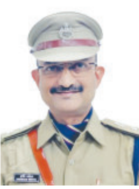
જૂનાગઢ તા.૨૪ નવરાત્રી મહોત્સવ સહિતના

નવરાત્રી, દશેરા, દિપાવલી, બેસતું વર્ષ, ભાઈ બીજ સહિતના તહેવારોને ધ્યાને આગવી વ્યુહરચના : પોલીસ કામગીરીની સરાહના