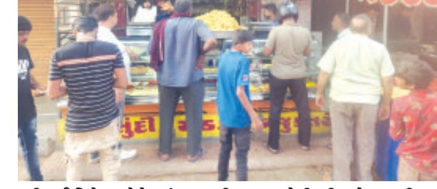
(કુંજન રાડીયા દ્વારા) જામખંભાળીયા તા.૨૪ આદ્યશક્તિની ઉપાસનાના નવરાત્રી પર્વ પછી આસુરી શક્તિ પર દેવી શક્તિના વિજયના મહાપર્વ એવા દશરા નિમિત્તે આજરોજ ખંભાળીયાના ફરસાણ

-મીઠાઈ વિકેતાઓને ત્યાં સવારથી જ ગ્રાહકોની ભીડ જોવા મળી હતી. વર્ષોથી વણલખી પરંપરા જાળવી રાખીને ખંભાળીયા શહેર તથા આસપાસના લોકોએ જલેબી-ફાફડાની મોજમાણી હતી. શહેરના મોટાભાગના વેપારીઓને ત્યાં આજે વિજયાદશમી નિમિત્તે જલેબી, ગાંઠિયાની ખરીદી કરતા મોટી સંખ્યામાં નગરજનો જોવા મળ્યા હતા. આ સાથે વિવિધ પ્રકારની મીઠાઈઓ આરોગીને નગરજનોએ દશરા પર્વની ઉજવણી કરી હતી. અહીંના મીઠાઈ અને ફરસાણના દુકાનદારોને ત્યાં નગરજનોએ જલેબી સાથે ફાફડા, ફાફડી, વણેલા વિગેરે પ્રકારના ગાંઠિયાઓ સાથે મીઠાઈ ખરીદી અને આ પર્વની ધર્મમય ઉજવણી કરી હતી.