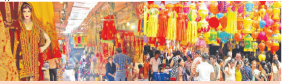
ઘર સજાવટની ચીજવસ્તુઓથી લઈ તમામ બજારોમાં ખરીદીનો મહોલ