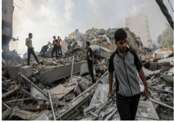
(એજન્સી) તા. ૨૭

તાજેતરમાં ગાઝા પટ્ટીમાં એક હોસ્પિટલમાં વિસ્ફોટ થયા પછી સેંકડો લોકોના મૃત્યુ થયા છે. હમાસ જે ગાઝાનું નિયંત્રણ કરે છે, તેણે આ વિસ્ફોટને ઈઝરાયેલના હવાઈ હુમલાને જવાબદાર ઠેરવ્યો હતો. ઈઝરાયેલે કહ્યું છે કે, તે અન્ય સશસ્ત્ર જૂથ, પેલેસ્ટીની ઈસ્લામિક જેહાદ દ્વારા ચલાવવામાં આવેલા એક ભૂલથી રોકેટને કારણે થયું હતું, જેણે આ નિવેદનને નકારી કાઢ્યું હતું. બુધવારે રાષ્ટ્રપતિ જો બાઈડેને ઈઝરાયેલની સ્થિતિને સમર્થન આપ્યું હતું. આવા સ્પર્ધાત્મક દાવાઓની સ્વતંત્ર રીતે ચકાસણી કરવામાં આવી નથી. ધ ન્યૂયોર્ક ટાઈમ્સ ફોટા, વીડિયો ફૂટેજ અને અન્ય પુરાવાઓના વિશ્લેષણ તેમજ ઈન્ટરવ્યૂ દ્વારા વિવિધ રીતે મૂલ્યાંકન કરવા માટે કામ કરી રહ્યું છે. ગાઝા શહેરની અહલી અરબ હોસ્પિટલમાં વિસ્ફોટ વિશે આપણે અત્યાર સુધી શું જાણીએ છીએ :-