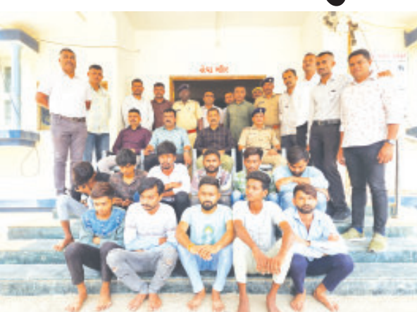
(રાકેશ પરડવા દ્વારા) વેરાવળ, તા.૮ વેરાવળ નજીકના ડારી ટોલ બુથ પર મધ્યરાત્રીના ૧૧ શખ્સોએ આતંક મચાવી તોડફોડ કરી લુંટ ચલાવ્યાની ઘટનાના પગલે ચક્રચાર મચી છે. પોલીસની પ્રાથમિક તપાસમાં બીજ ગામના સરપંચ પુત્ર દ્વારા પૂર્વઆયોજિત કાવતરું રચી ઘાડ