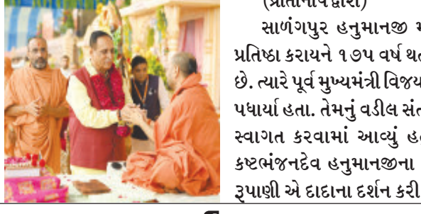
(પ્રતિનિધિ દ્વારા) સાળંગપુર તા.૨૦ સાળંગપુર હનુમાનજી મંદિર ખાતે દાદાની મૂર્તિની પ્રાણ પ્રતિષ્ઠા કરાવેને ૧૭૫ વર્ષ થતાં શતામૃત મહોત્સવ ઉજવાઈ રહ્યો છે. ત્યારે પૂર્વ મુખ્યમંત્રી વિજયભાઈ રૂપાણી શતામૃત મહોત્સવમાં પધાર્યા હતા. તેમનું વડીલ સંતો દ્વારા સભા મંડપમાં ઉમંગલાભેર સ્વાગત કરવામાં આવ્યું હતું. આ પછી વિજય રૂપાણી શ્રી કષ્ટભંજનદેવ હનુમાનજીના દર્શનને આવ્યા હતા. વિજયભાઈ રૂપાણી એ દાદાના દર્શન કરી મંદિર ઉપર ધજા ચઢાવી હતી.