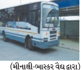
(મીનાક્ષી-ભાસ્કર વેઘ દ્વારા) પ્રભાસ-પાટણ તા.૨૦

સાંઈબાબા આવાસ અને બાયપાસ વિસ્તારમાંથી ઓટો રિક્ષામાં જોખમી મુસાફરી કરી પહોંચવાની ફરજ પડતી હોય તો જીલ્લા વહીવટી તંત્રને વેરાવળ એસટી તંત્ર દ્વારા રહેણાંક વિસ્તાર શ્રીપાલ હવેલી સાંઈબાબા આવાસ યોજના નમસ્તે સર્કલ વિસ્તાર ઉપર એસટી બસ સેવાઓ મેળા દરમ્યાન પાંચ દિવસ સુધી નમસ્તે સર્કલથી વાયા સાંઈબાબા મંદિર આવાસ થી વાલા ચોક શ્રીપાલ હવેલી ચોક રેવોનથી સોમનાથ મેળાની બસ સેવાઓ ઉપલબ્ધ થઈ શકે તે હેતુથી જીલ્લા હવેલકટર સહિત વહીવટી તંત્રએ આ બાબત ધ્યાને લઈ સીસાયટી વિસ્તાર ઉપર સીટીઝન મહીલાઓ બાળકો સહિત અન્ય પરિવારજનોએ મેળામાં અવર-જવર માટે મેળામાં પહોંચવા શ્રીપાલ હવેલી