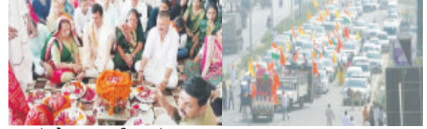
(રાકેશ સામાણી દ્વારા) દ્વારકા તા.૨૦

યાત્રાધામ દ્વારકામાં ૧૯૬૨ના ચીન યુધ્ધમાં વીરગતિ પામેલા આહીર હિરલાઓને શ્રધ્ધાંજલિ અપાઈ