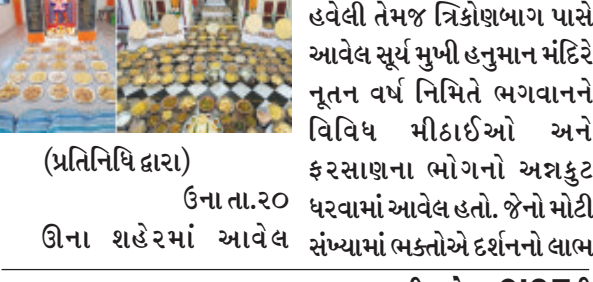
(પ્રતિનિધિ દ્વારા) ઉના તા.૨૦ ઉના શહેરમાં આવેલ પૌરાણીક રાધા દામોદરાયજીની હવેલી તેમજ ત્રિકોણભાગ પાસે આવેલ સૂર્ય મુખી હનુમાન મંદિરે નૂતન વર્ષ નિમિત્તે ભગવાનને વિવિધ મીઠાઈઓ અને ફરસાણના ભોગનો અગ્રકુટ ધરવામાં આવેલ હતો. જેનો મોટી સંખ્યામાં ભક્તોએ દર્શનનો લાભ