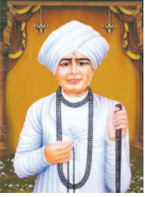
(પ્રતિનિધિ દ્વારા) જૂનાગઢ તા.૨૦

સવારથી જ પૂજ્ય જલારામ બાપાનું પૂજન, અર્ચન, આરતી, મહાપ્રસાદ, શોભાયાત્રા સહિતના અનેકવિધ કાર્યક્રમો યોજાયા