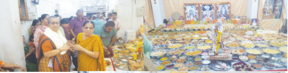
(પ્રતિનિધિ દ્વારા) જૂનાગઢ તા.૨૦