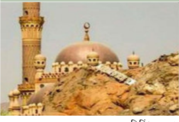
બિજિંગ, તા. ૨૪ મુસ્લિમો પર અત્યાચાર માટે કુખ્યાત બનેલા ચીનને લઈને એક નવો ખુલાસો થયો છે. ધૂમન રાઈટ્સ વોચના એક અહેવાલ