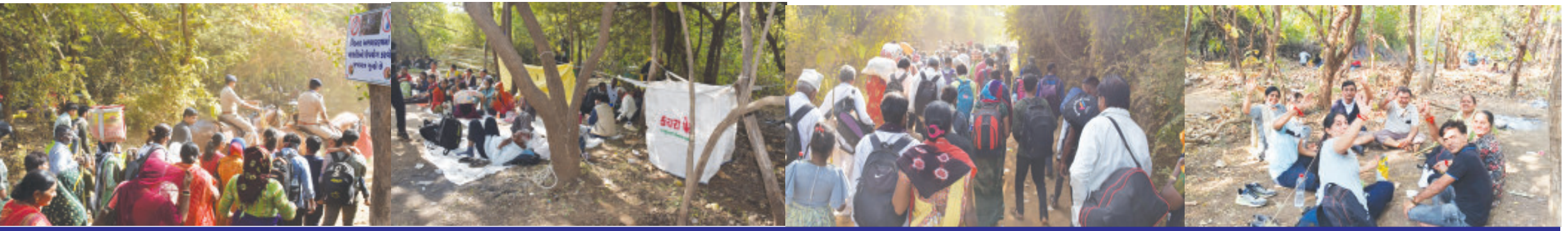
પરિક્રમાના પ્રારંભ પુર્વે જ ૩.૫૦ લાખથી પણ વધારે ભાવિકોએ પરિક્રમા પુર્ણ કરી ભજન, ભોજન અને ભક્તિનો ત્રિવેણી સંગમ સમા પરિક્રમાના મેળામાં જંગલમાં મંગલ જેવું દ્રશ્ય સર્જ્યું

(પ્રતિનિધિ દ્વારા) જૂનાગઢ તા.૨૪ ગરવા ગિનારની લીલી પરિક્રમાનું ખુબ જ મહત્વ હોય અને પરંપરા અનુસાર આ પરિક્રમામાં પુણ્યનું ભાથું બાંધવા ભાવિકો અને શ્રદ્ધાળુઓનો માનવ મહેરામણ દર વર્ષે ઉમટી પડે છે. આ વર્ષે પણ દુર-દુરથી આવેલા ભાવિકો અને શ્રદ્ધાળુઓ ગિરનારની લીલી પરિક્રમામાં જતા હોય છે. આ વર્ષે પણ