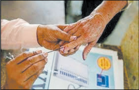
હેંદરાબાદ તા. ૩૦ પાંચ રાજ્યોની વિધાનસભા ચૂંટણીમાં આજે અંતિમ રાજ્ય તેલંગાણાની

તમામ પાંચ રાજ્યોના એકઠીટપોલની ઉત્તેજના સાથે તા.૩૦ મતગણતરીનો સપ્તેન્સ પણ ચાલુ થઈ જશે. લગભગ દોઢ માસ લાંબા પાંચ રાજ્યોની વિધાનસભા ચૂંટણી જંગમાં ત્રિપાંખીયો જંગ છે. જેમાં શાસક ભારત રાષ્ટ્ર સમીતી, વિપક્ષ કોંગ્રેસ અને દક્ષિણમાં ઘુસવા માટે પ્રયત્નશીલ ભાજપ હાલ મેદાનમાં છે. ખાસ કરીને મુખ્યમંત્રી કે.ચંદ્રશેખર રાવ માટે ભવિષ્યની મોટી ભૂમિકા માટે તેમના જ રાજ્યમાં સતત ત્રીજી વખત સત્તા