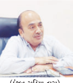
(કુંજન રાડિયા દ્વારા) જામ ખંભાળિયા તા. ૧૪

દેવભૂમિ દ્વારકા જિલ્લાના તમામ ચાર તાલુકાઓમાં પીજીવીસીએલ દ્વારા વિવિધ બાબતના પ્રોજેક્ટ માટેની કામગીરી હાથ ઉપર લેવામાં